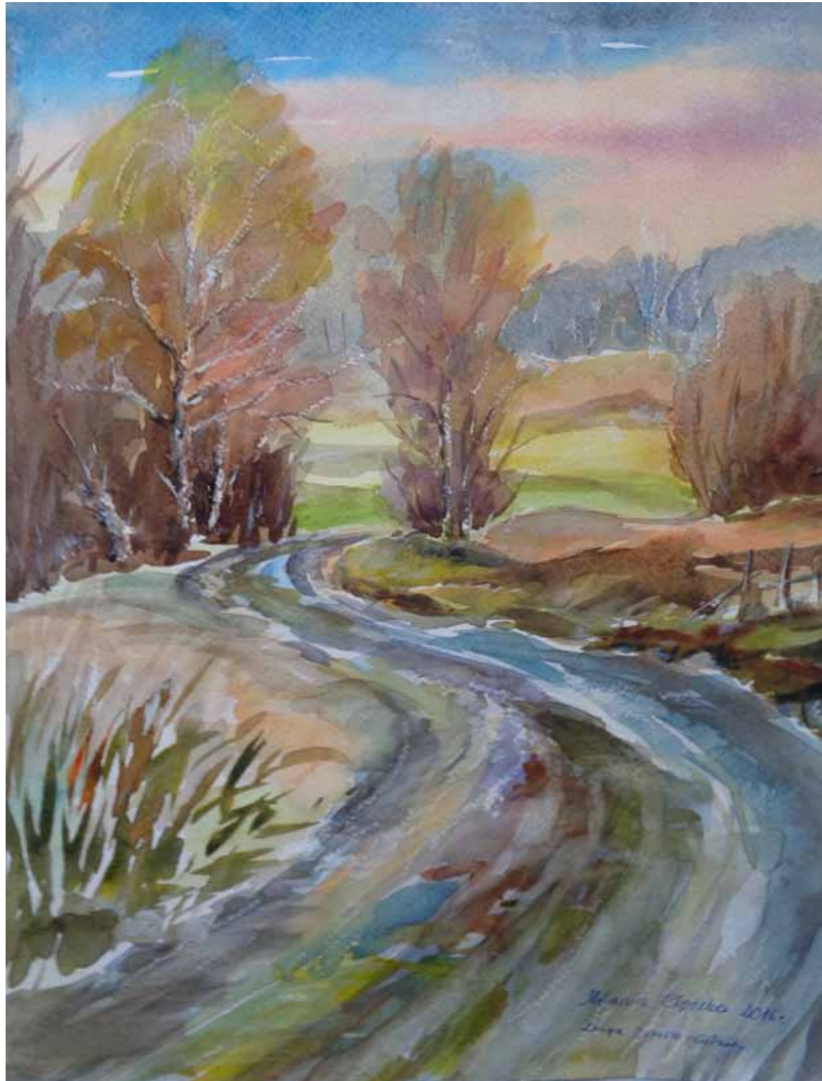
Przedwiośnie. Droga Deresze – Giławy