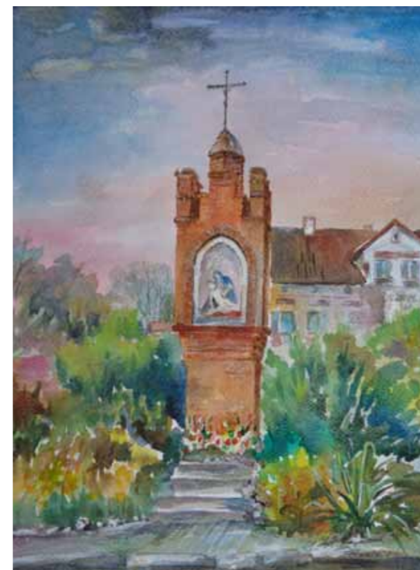
Kapliczka w Gietrzwałdzie