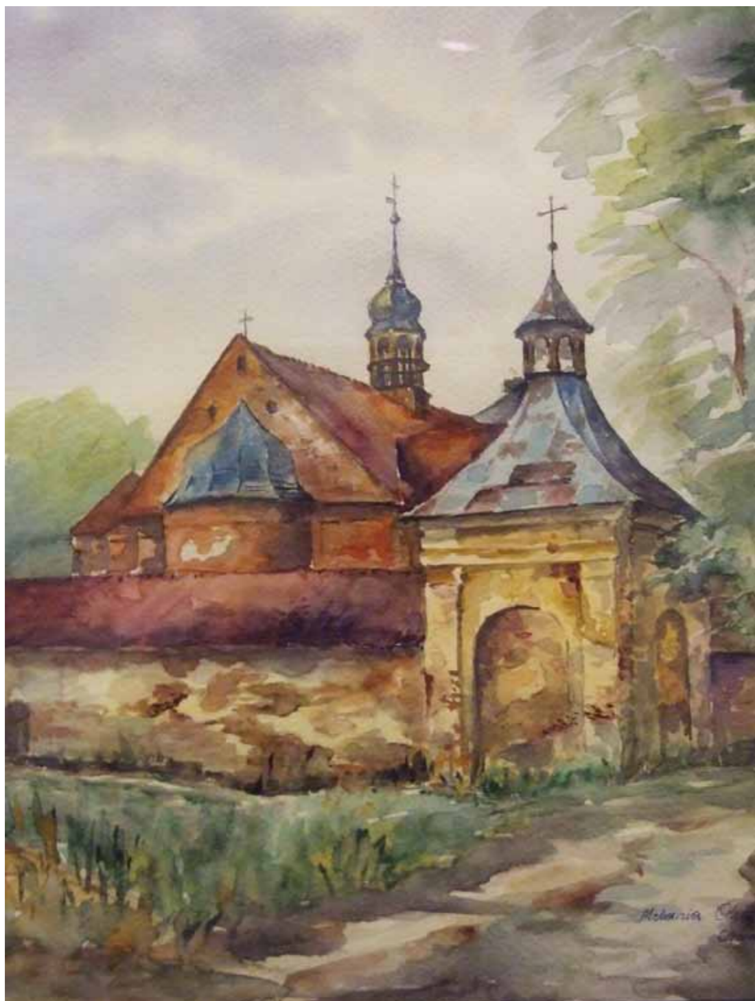
Chwałęcín - sanktuarium