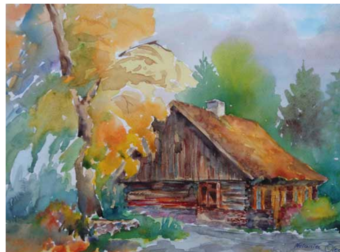
Dom warmiński w Gietrzwałdzie