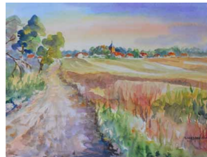
Droga do Praslit

Warmia w przeciwieństwie do Mazur, gdzie dominują duże kompleksy leśne z licznymi jeziorami, jest przede wszystkim krainą rolniczą o względnie żyznych glebach. W jej krajobrazie widoczne są liczne stare wsie i osady z kościołami sięgającymi czasów średniowiecza oraz pałacami dawnych ziemian. Nie ma tego na Mazurach, gdzie osadnictwo jest znacznie młodsze. Miasta warmińskie też różnią się od mazurskich, są przede wszystkim starsze, co poznać można po średniowiecznych układach urbanistycznych, często z zachowanymi kamienicami, ratuszami i pozostałościami dawnych murów miejskich, co widoczne jest jeszcze w Reszlu, Lidzbarku Warmińskim czy Orniecie. Ogólnie rzecz biorąc budownictwo na Warmii nie różniło się zasadniczo od mazurskiego. Na wsiach dominowały budynki z czerwonej cegły, nierzadko z kamienną podmurówką i łączeniami drewnianych belek oraz