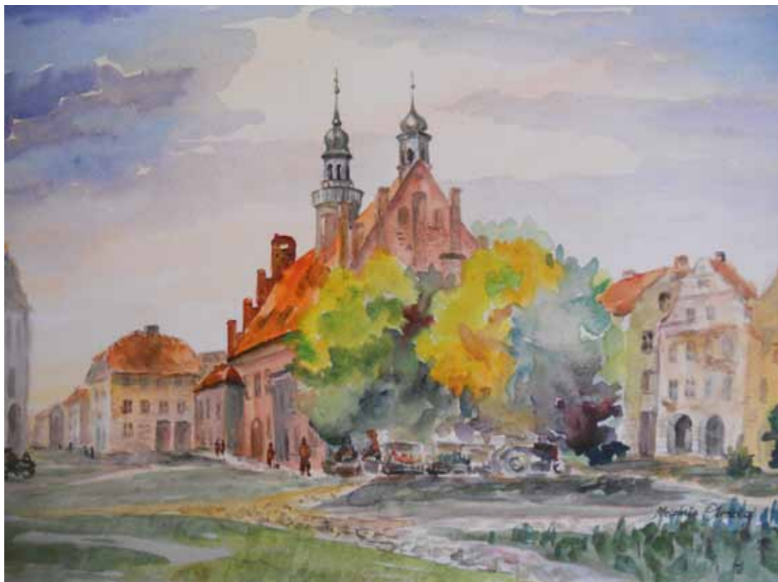
Orneta, ratusz i rynek