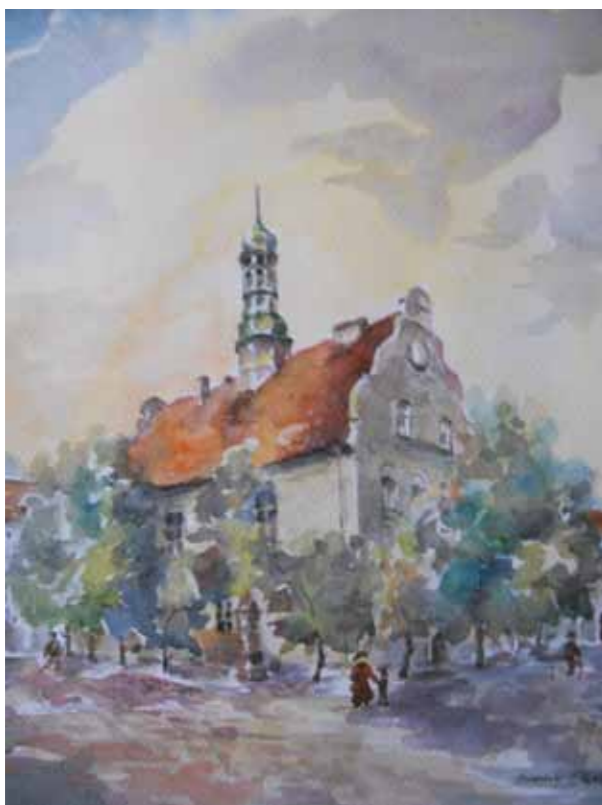
Dobre Miasto, nieistniejący już ratusz