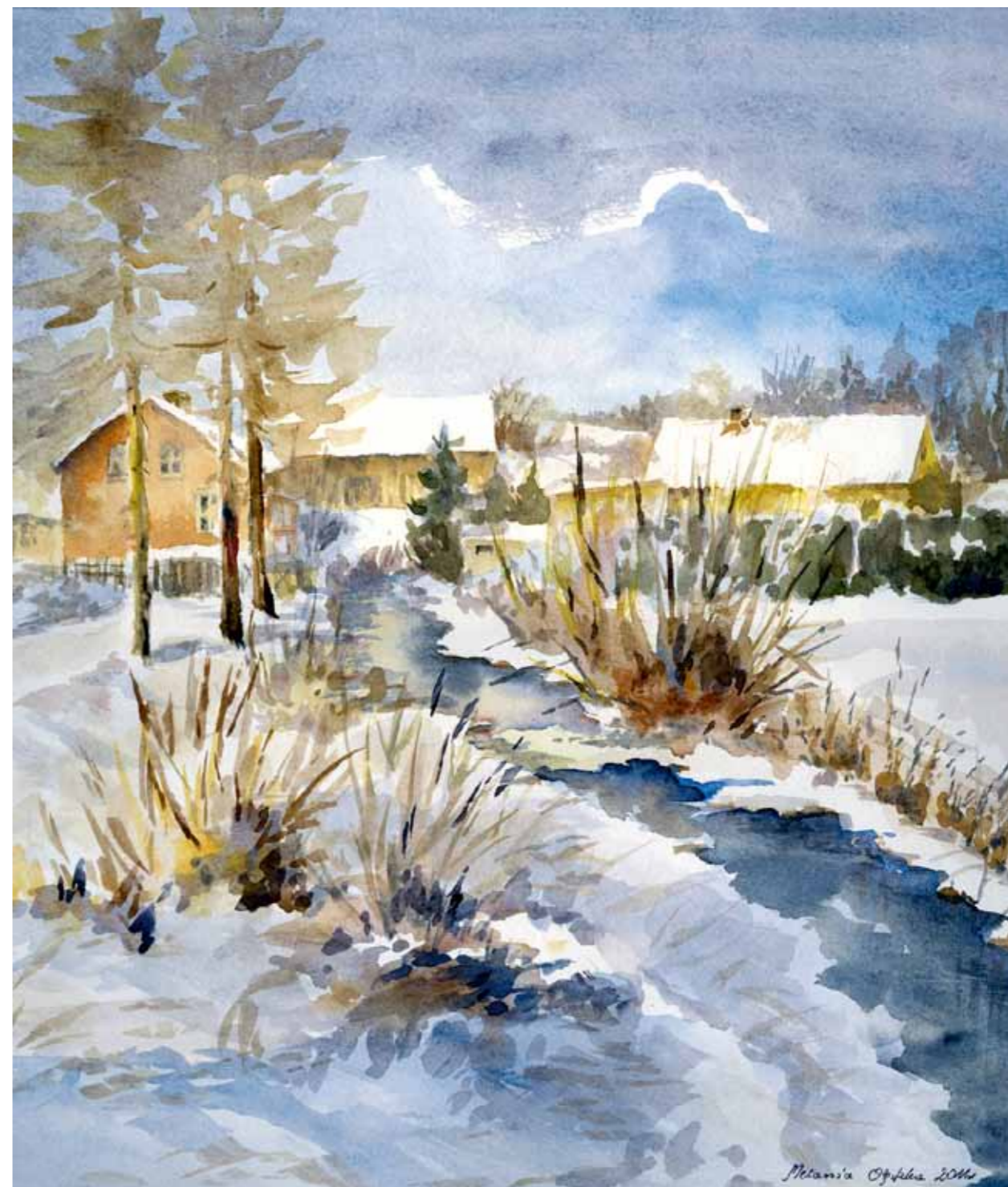
Zima w Bartązku