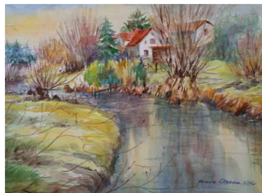
Wiosna nad Gilwą