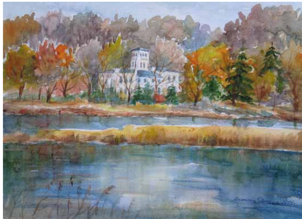
Dwór w Łajsach koło Gietrzwałdu