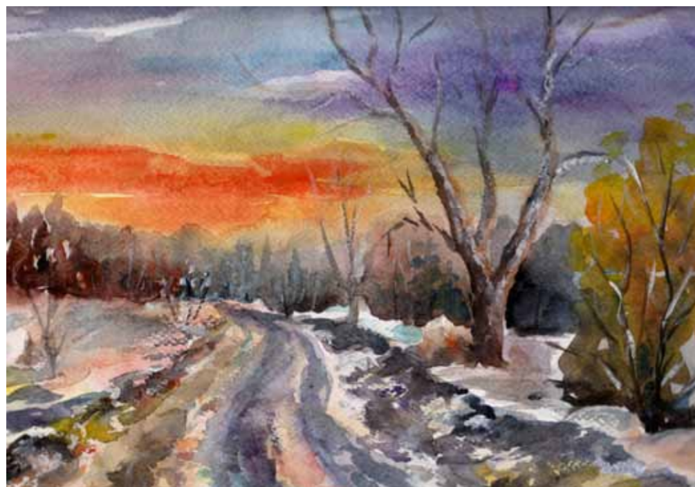
Droga do Brzeźna

Dawno już zniknęły z pejzażu obu krain młyny wodne i wiatraki – zarówno drewniane koźlaki, jak i te murowane, a po licznych niegdyś cegielniach pozostały jedynie kominy. Zachowały się za to solidnie budowane wieże ciśnień obecne niegdyś we wszystkich miasteczkach mazurskich, dziś mające charakter zabytków. Na Warmii przetrwały w dobrym stanie ceglane gotyckie zamki obronne w Olsztynie, Lidzbarku i Reszlu, a na Mazurach w Nidzicy, Rynie i Kętrzynie. Przetrwały też wspaniałe zabytki architektury sakralnej wśród których wymienić należy gotyckie kościoły św. Jakuba Starszego w Olsztynie, św. św. Jana Chrzciciela i Jana Ewangelisty w Orniecie, kolegiatę Chrystusa Zbawiciela w Dobrym Mieście, katedrę fromborską, a także sanktuaria Maryjne w Gietrzwałdzie, Krośnie i Chwałcinie koło Ornety, Stoczku Klasztornym oraz w Świętej Lipce leżącej już po mazurskiej stronie. Spośród licznych niegdyś i okazałych pałaców Warmii i Mazur niewiele pozostało w dobrym stanie do dzisiejszego dnia. Te, które oszczędziła wojna zrujnowane zostały przez przypisanych im użytkowników w okresie PRL. Część z nich udało się uratować (zespoły pałacowo-parkowe w Smolajnach, Karnitach, Galinach, Łężanach, Sorkwicach i Drogoszach) – dziś są świadectwem świetności dawnej Warmii i całych Prus Wschodnich.