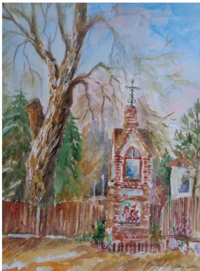
Kapliczka w Purdzie