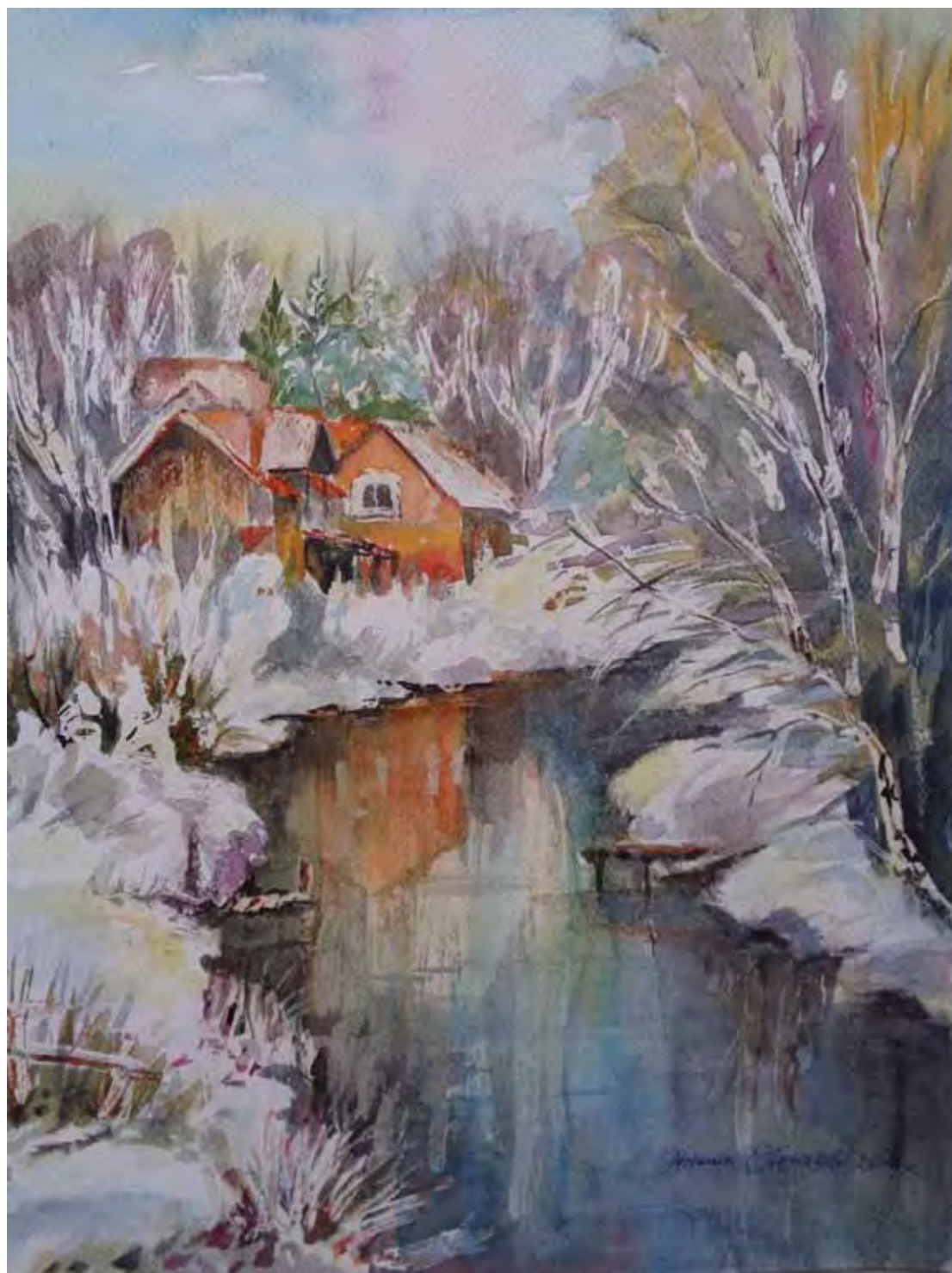
Głwa w okowach zimy