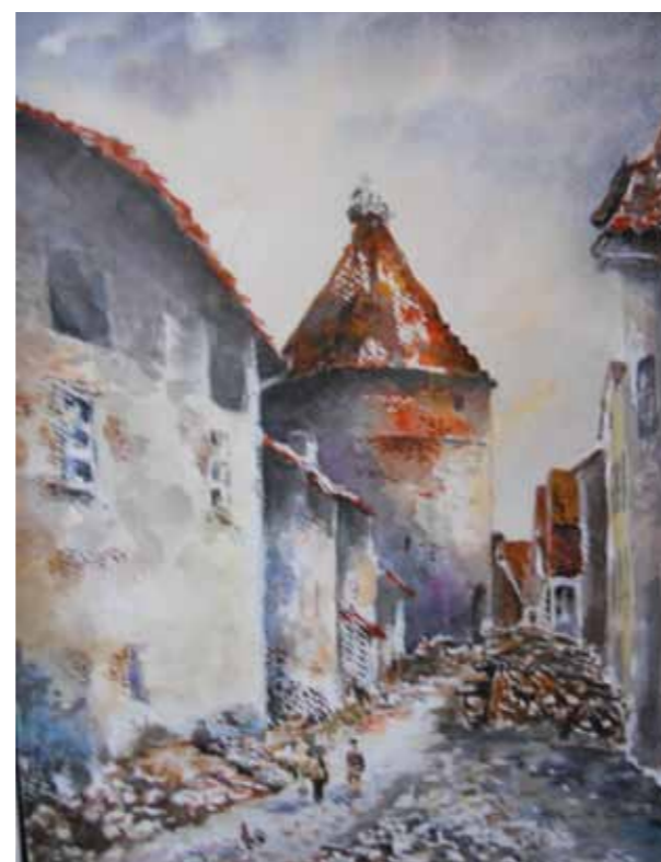
Dobre Miasto, uliczki