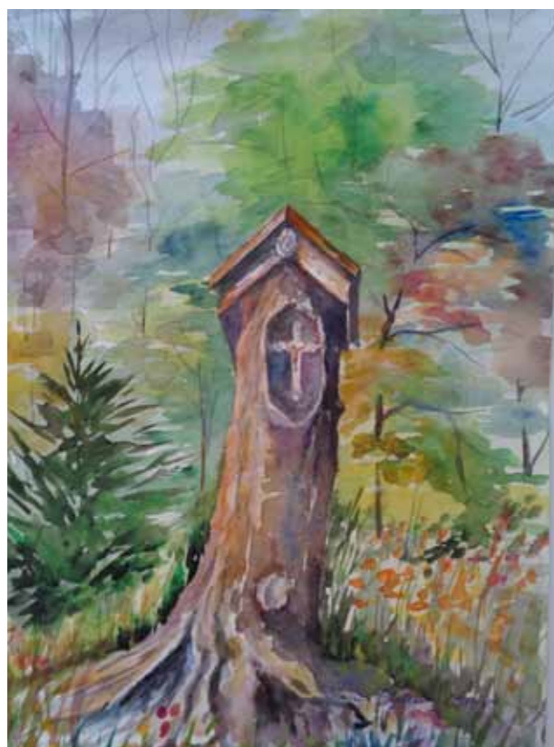
Kapliczka w Gronitach