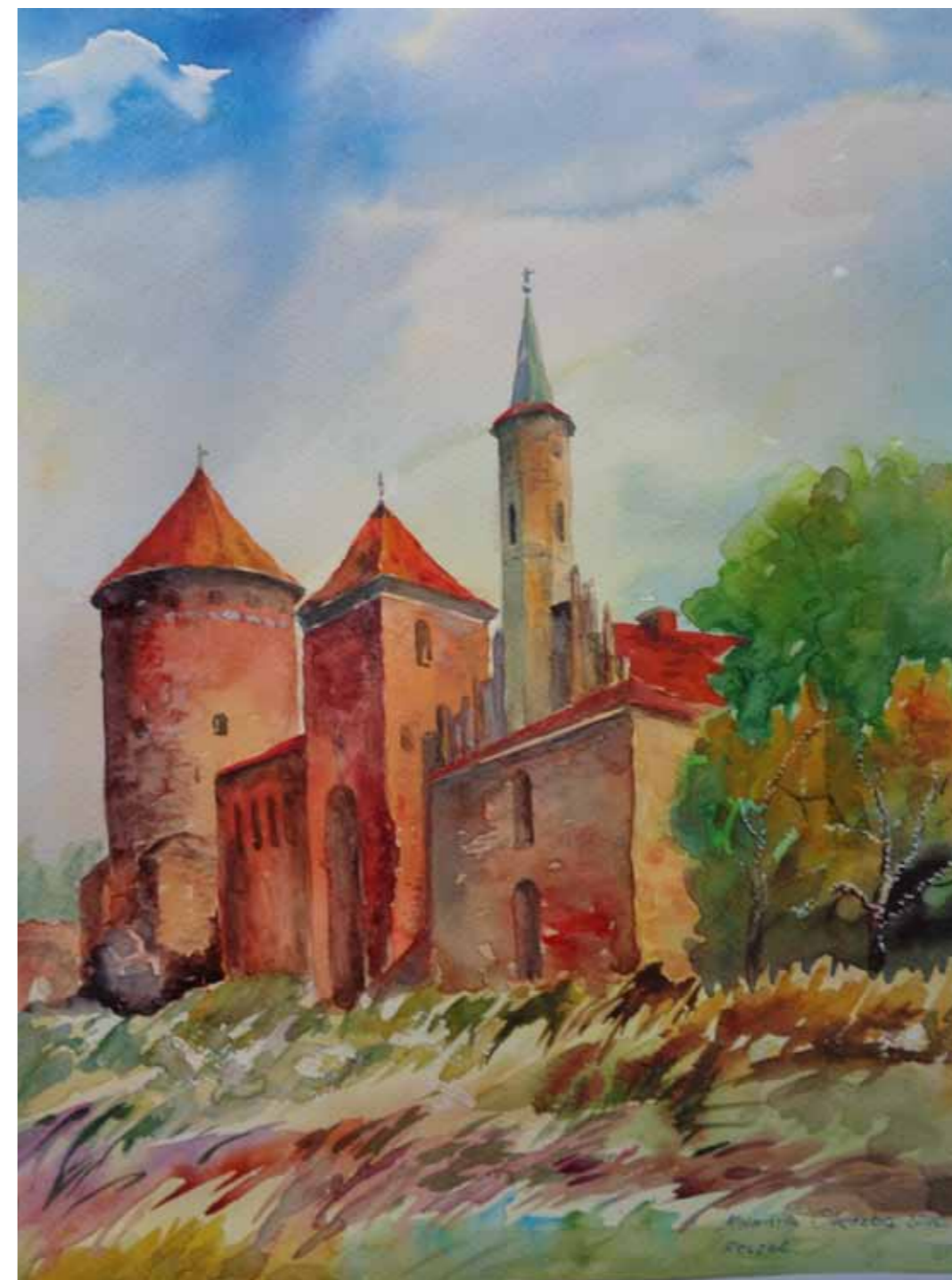
Zamek w Reszlu. Zamek należał, podobnie jak w Ornecie, Lidzbarku Warmińskim, Jezioranach i Braniewie, do tzw. zamków biskupich. Często przybywali tu kolejni biskupi warmińscy. Obecnie na zamku mieści się m.in. oddział Muzeum Warmii i Mazur w Olsztynie, hotel i restauracja.