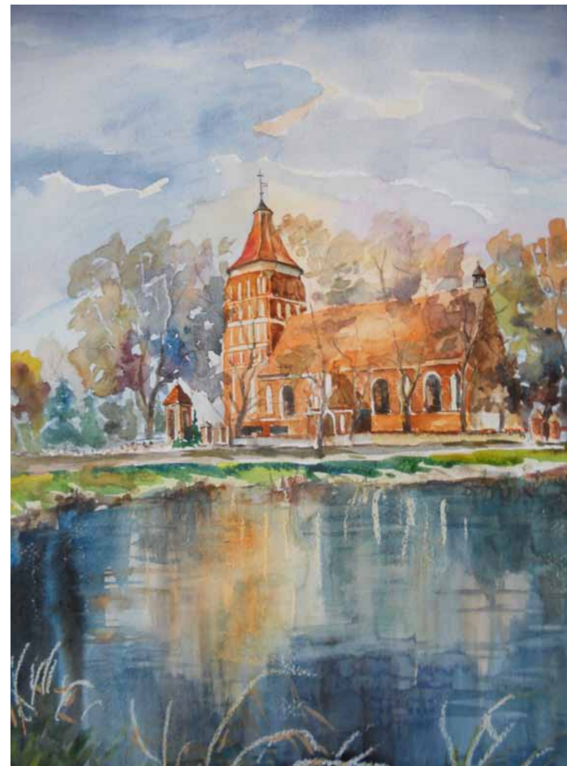
Lubomino - kościół pw. sw. Katarzyny Przemienienia Pańskiego