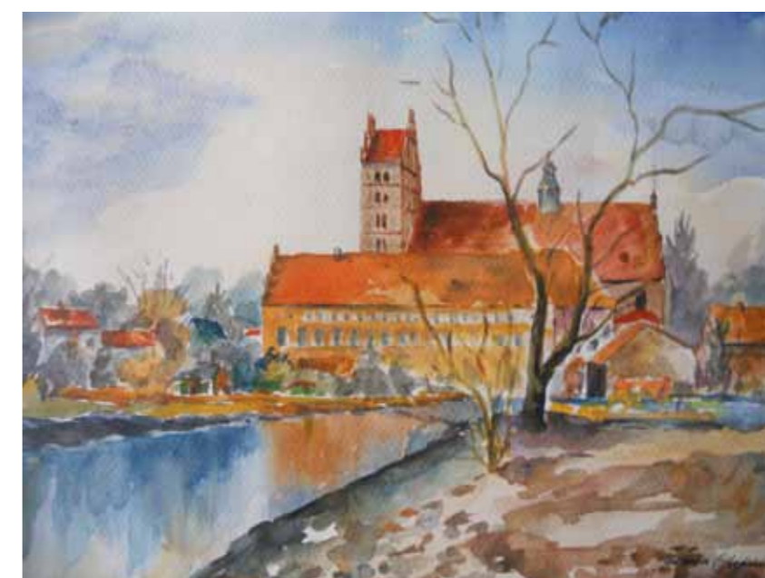
Dobre Miasto, kolegiata