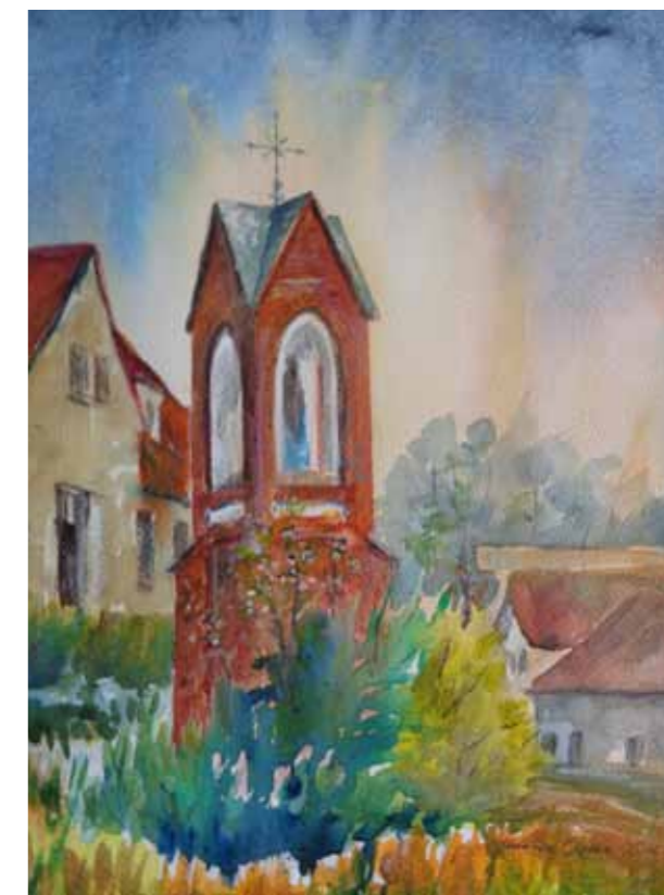
Kapliczka w Gietrzwałdzie