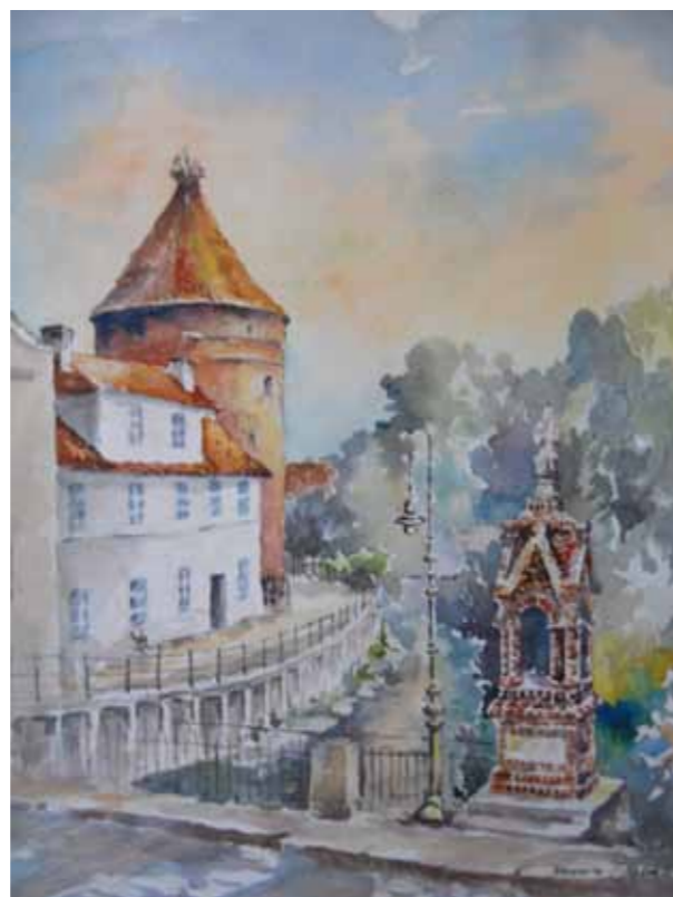
Dobre Miasto, most z kaliczką św. Nepomucena