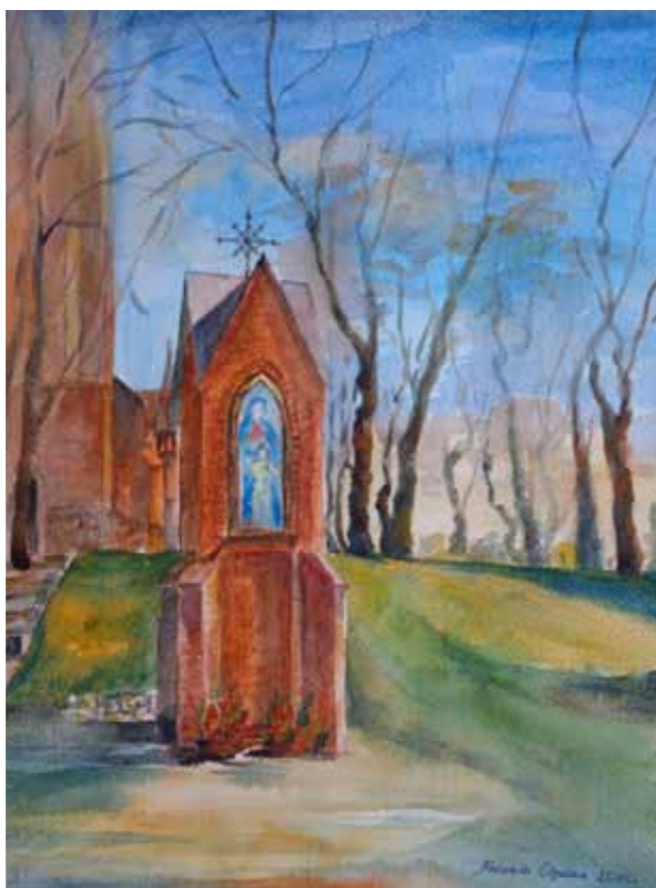
Kapliczka w Gietrzwałdzie