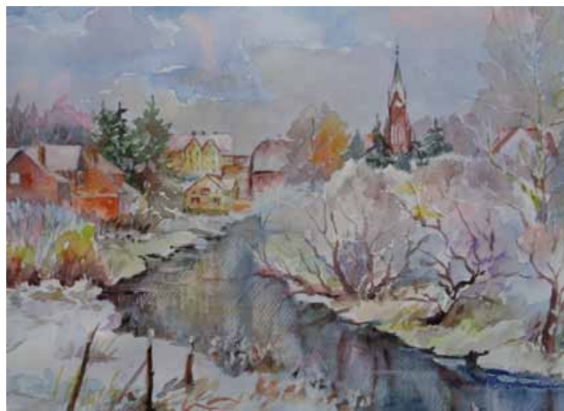
Zabudowa nad rzeką Giławaw Gietrzwałdzie

Część dawnych Prus Wschodnich, która znalazła się w powojennych granicach Polski przyjęła nazwę Warmia i Mazury. Dawnych mieszkańców zastąpili osadnicy z Kresów Wschodnich, Mazowsza, Kurpiwoszczyzny i ukraińscy przesiedleńcy z Bieszczad, ale w krajobrazie tych ziem po dziś dzień widoczne są ślady dawnej przeszłości. O obecności pogańskich Prusów świadczą odkryte grodziska, narzędzia, sprzęty; o zakonie krzyżackim – gotyckie zamki; o Polakach i polskiej tożsamości narodowej – kościoły, zamki biskupie i kapitulne oraz nazwy miejscowości; o świetności żyjących tu rodów – ruiny pałaców junkrów pruskich, dwory i miejskie kamienice; o dawnych podziałach administracyjnych – zapomniane słupy graniczne; o poziomie gospodarki – kanały, mosty, drogi, budynki przemysłowe, koszary, zabudowa gospodarstw wiejskich; o samych mieszkańcach – cmentarze, dokumenty i fotografie; zaś o działalności wybitnych postaci – ich osiągnięcia artystyczne, literackie i naukowe.