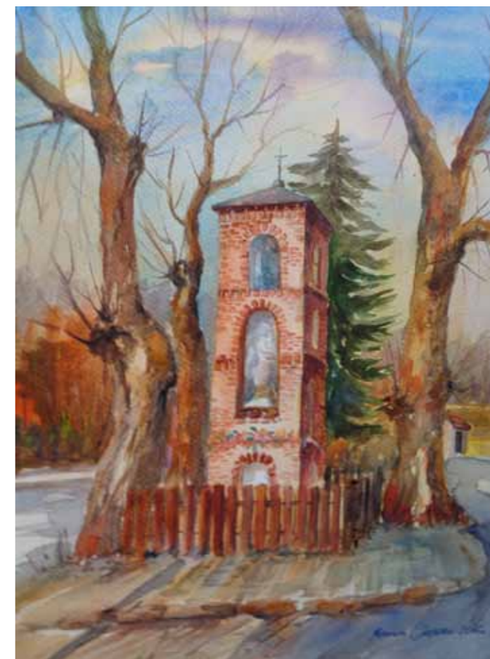
Kapliczka w Worytach