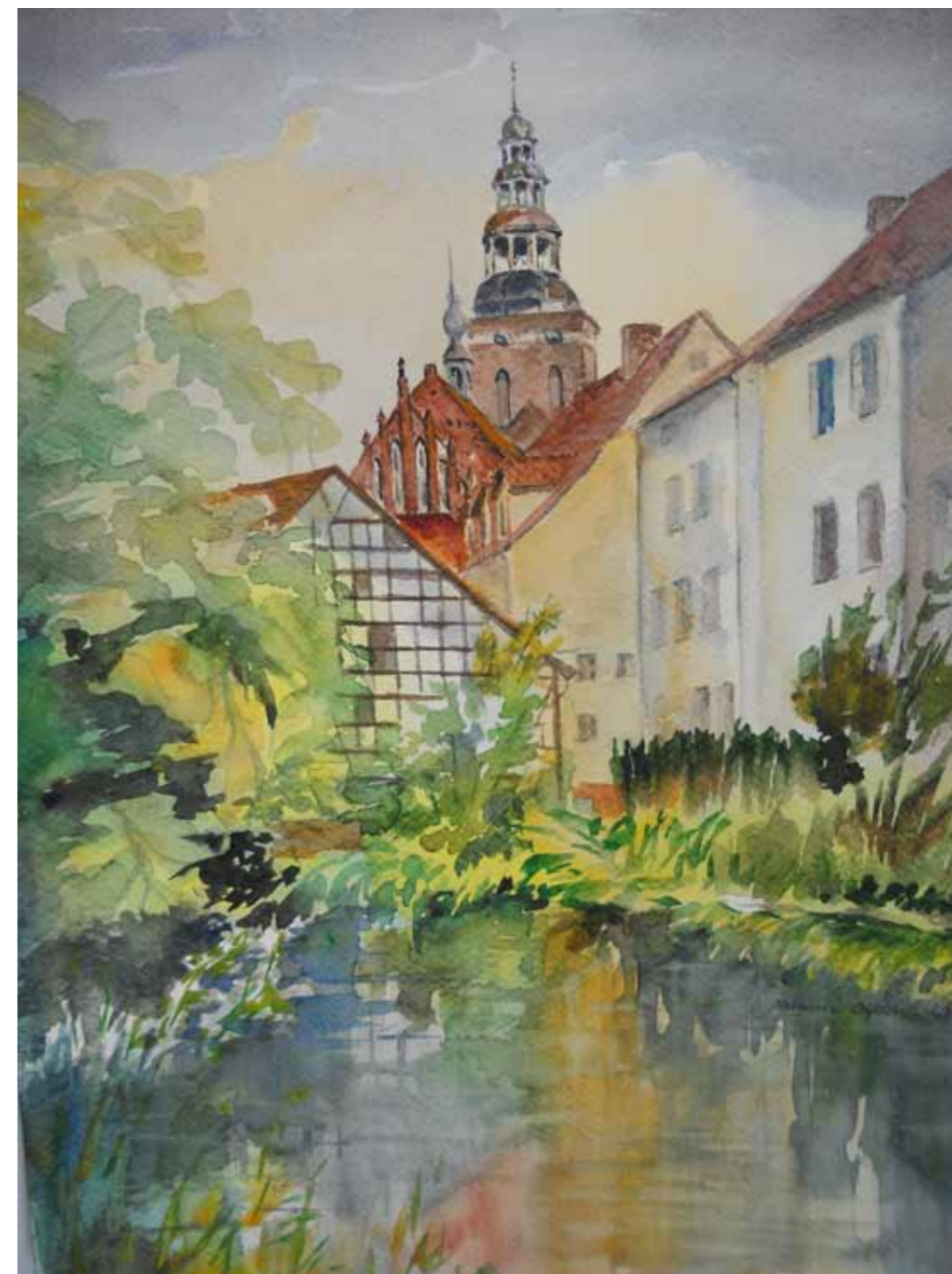
Lidzbark Warmiński. Widok na Łynę i kościół pw. Świętych Apostołów Piotra i Pawła