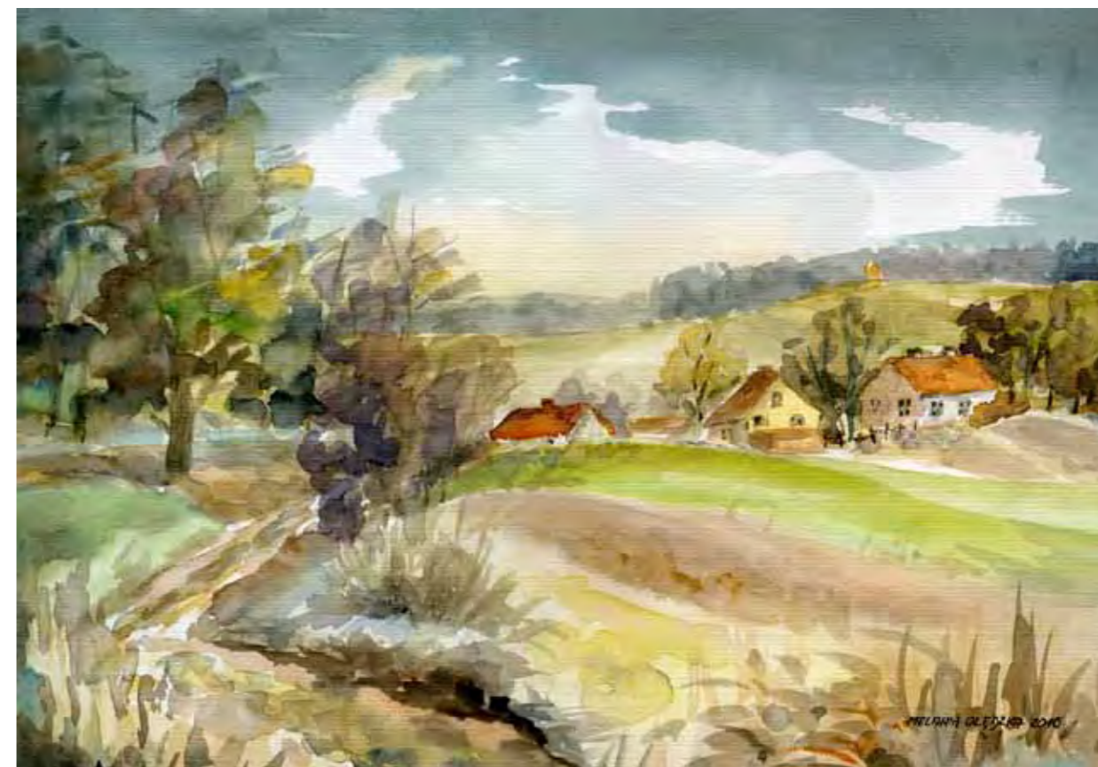
Lato. Droga w Brąswaldzie