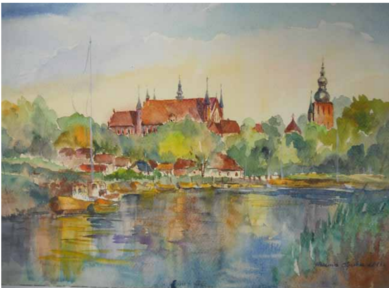
Frombork. Widok od strony Zalewu Wiślanego na Bazylikę Archikatedralną Wniebowzięcia NMP i św. Andrzeja