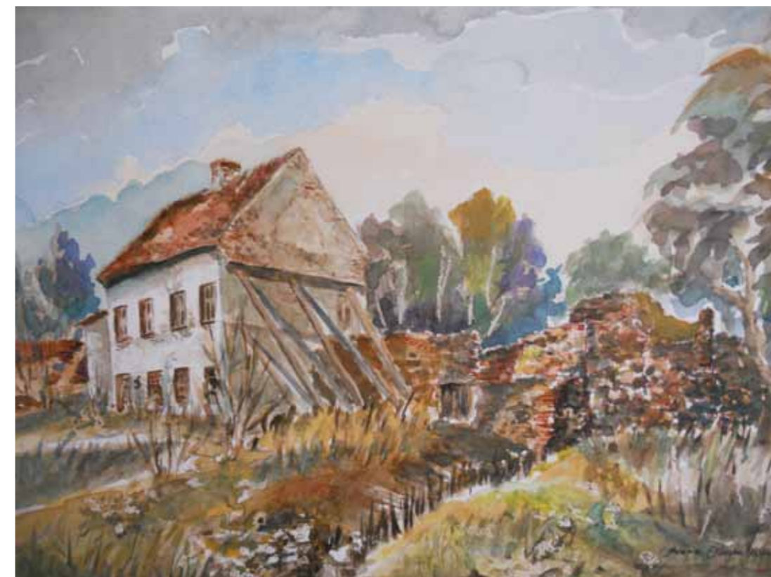
Dobre Miasto, pozostałości murów miejskich