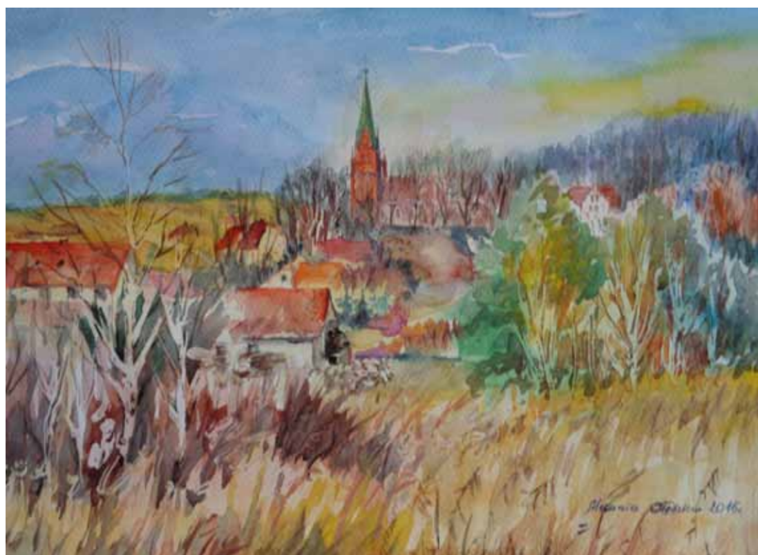
Panorama wsi Gietrzwałd