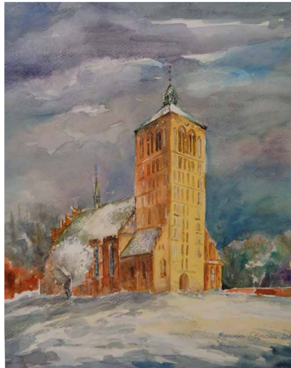
Baraniewo, kościół podniesiony z ruin