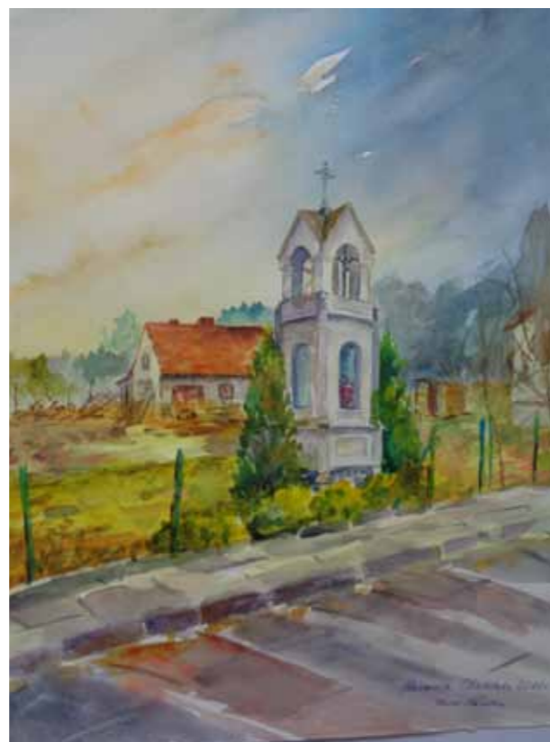
Kapliczka w Nowej Kaletce