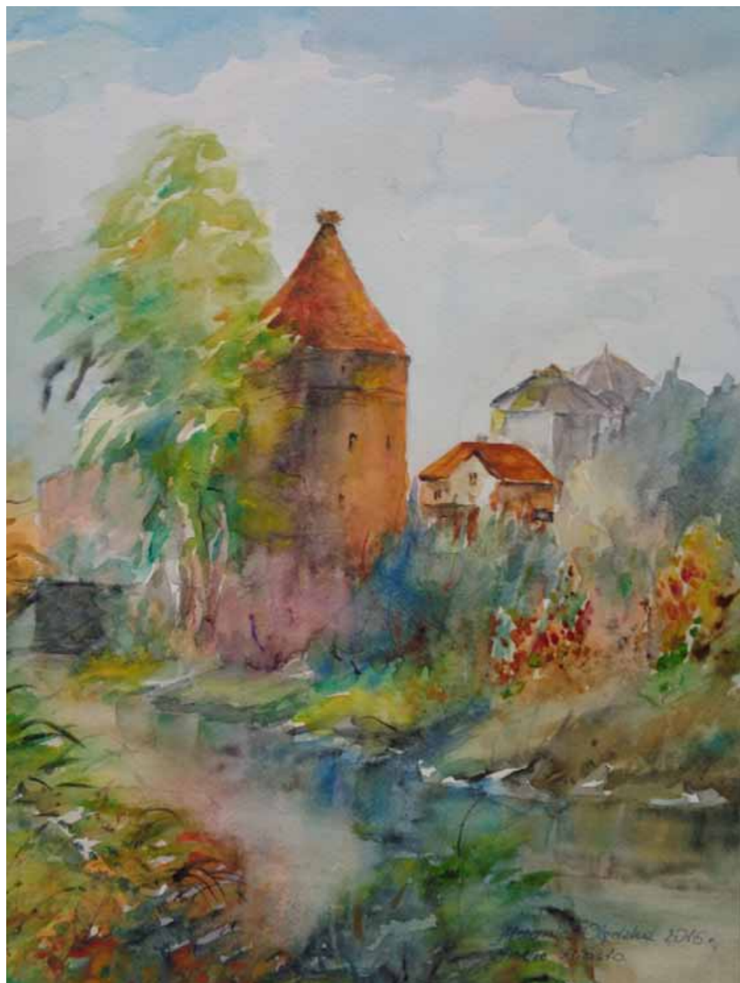
Dobre Miasto, ikona miasta Bociania Baszta