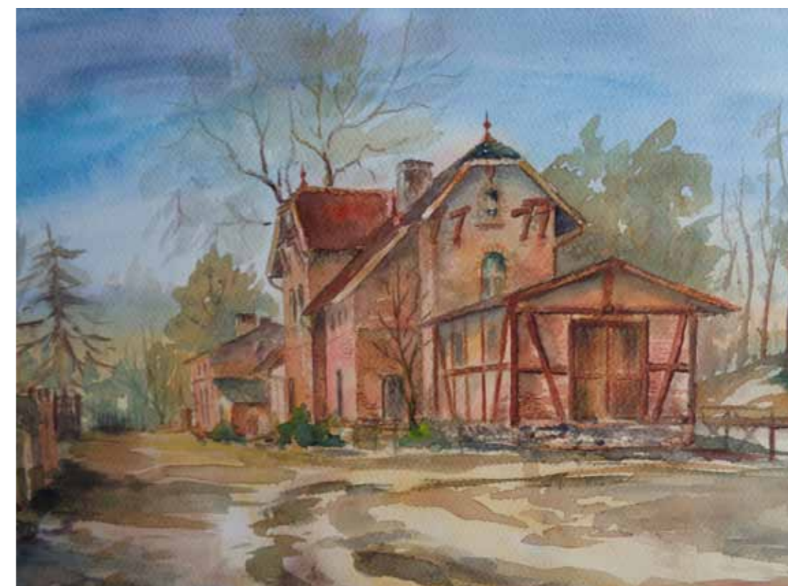
Unieszewo - dworzec