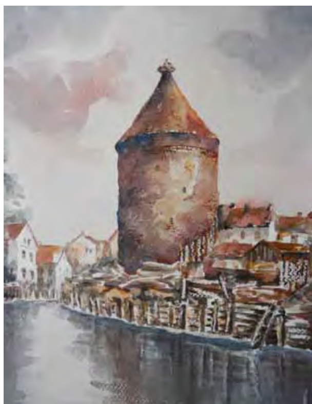
Dobre Miasto, Bociania Baszta od strony Łyny