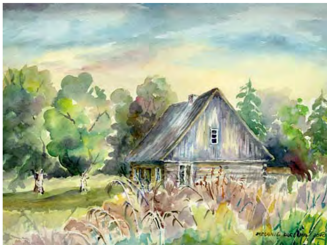
Dom warmiński w Tomaszowie