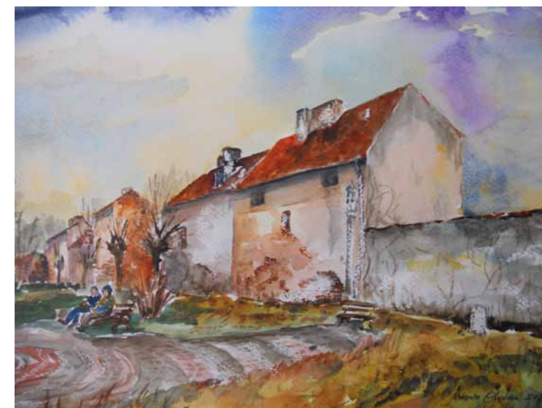
Dobre Miasto, kamieniczki budowane na dawnych murach miejskich