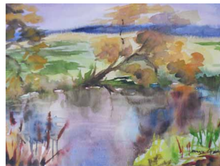
Jesień nad Łyną