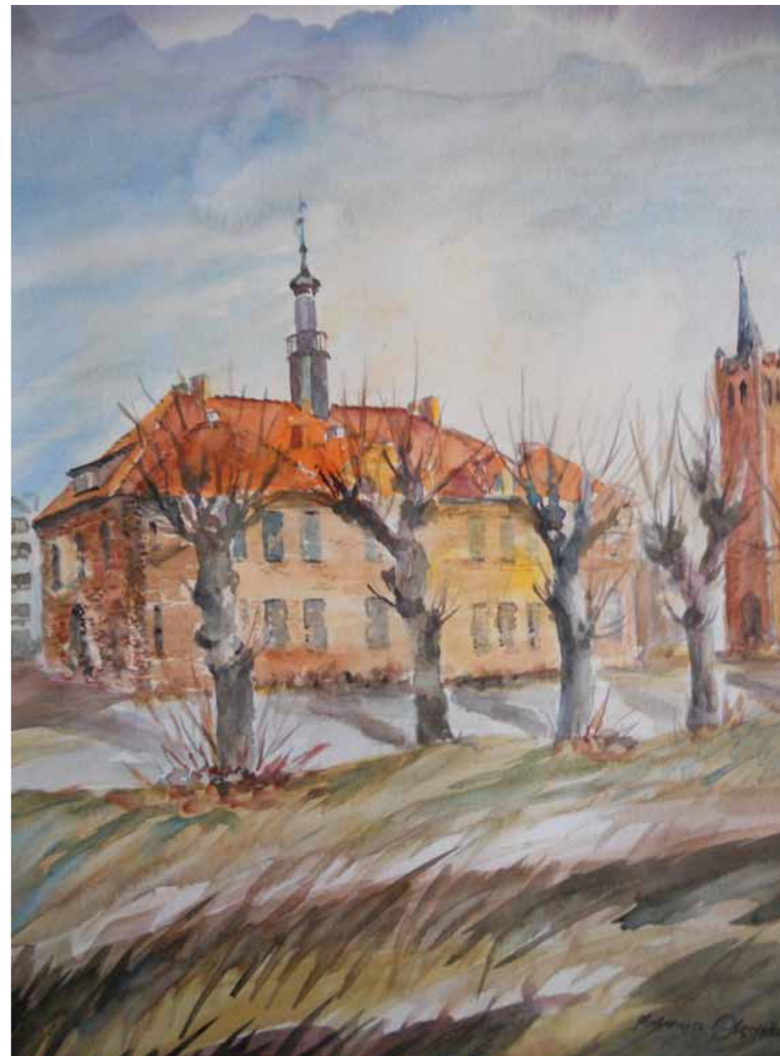
Pięszno - odnowiony ratusz