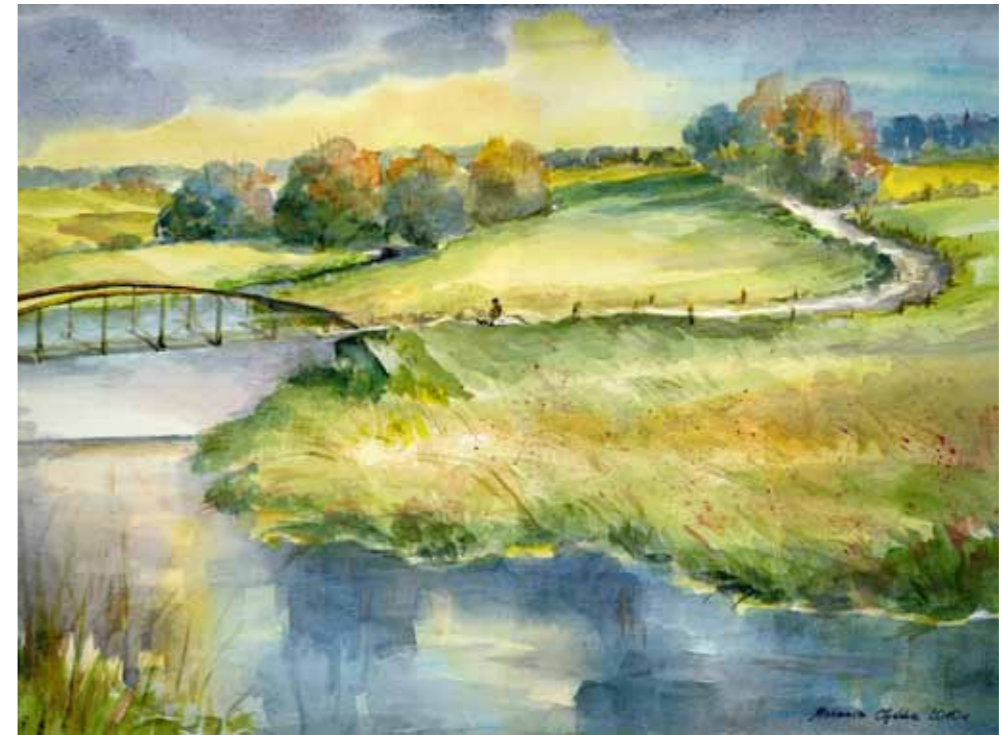
Most na Łynie