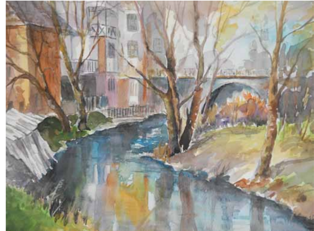
Olsztyn, widok współczesny na most św. jakuba

Olsztyn to miasto licznych mostów. Najważniejszymi z nich są: Most Mariacki, Most Młyński, Most Smętka, Most św. Barbary, Most św. Jakuba, Most św. Jana Nepomucena oraz Most Zamkowy. Mosty zbudowano nad rzekami: Łyną, Wadągą i Kortówką oraz jeziorem Długim.