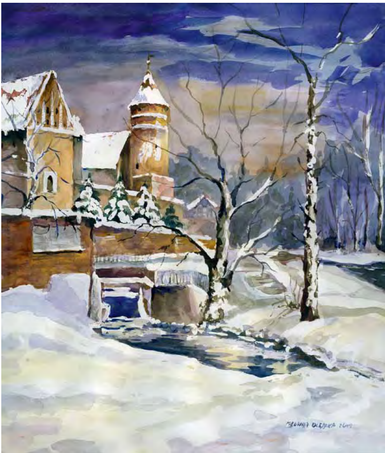
Zamek w Olsztynie zimą, 2011 r. Na pierwszym planie tzw olsztyńska Niagara