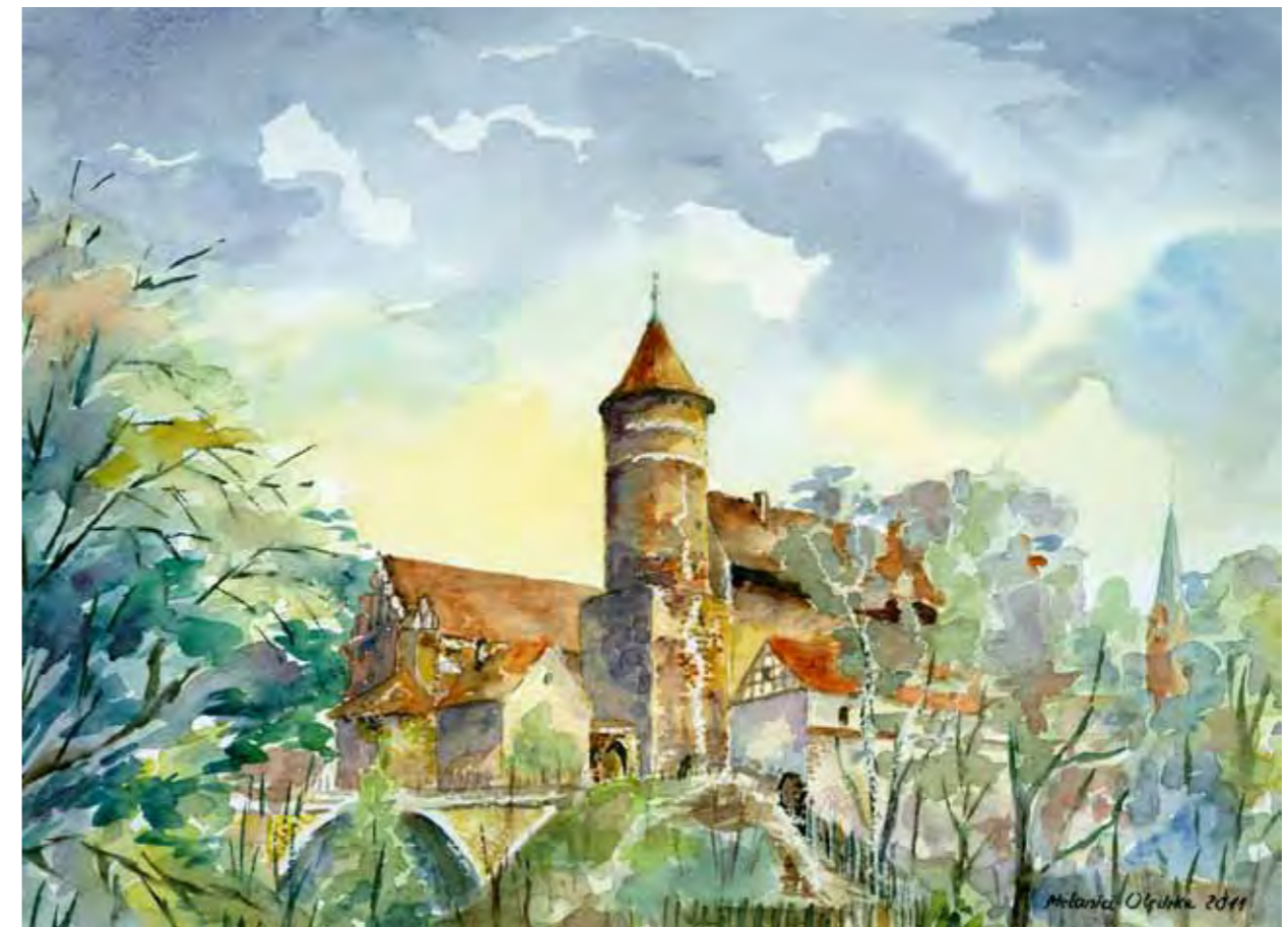
Zamek w Olsztynie z kopyłą 1926, lata 30 XX w. widok od strony południowo-zachodniej, za mostem Zamkowym