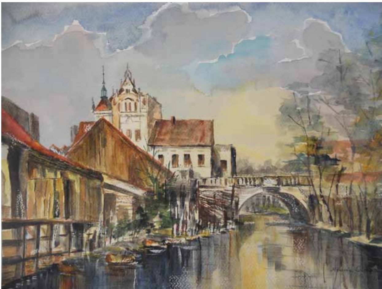
Olsztyn „Wenecja nad Łyną”, widok na most św. jakuba