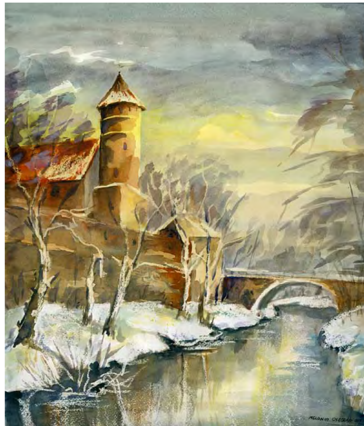
Zamek w Olsztynie zimą, 2010 r. Most Zamkowy