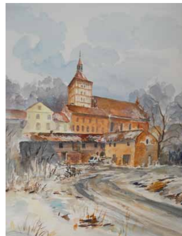
Katedra św. Jakuba w Olsztynie Dawne zabudowania - tu powstanie Dom Pielgrzyma