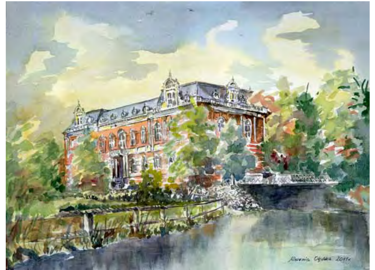
Gmach Starostwa Powiatowego odsłonięty w październiku 1894 r.