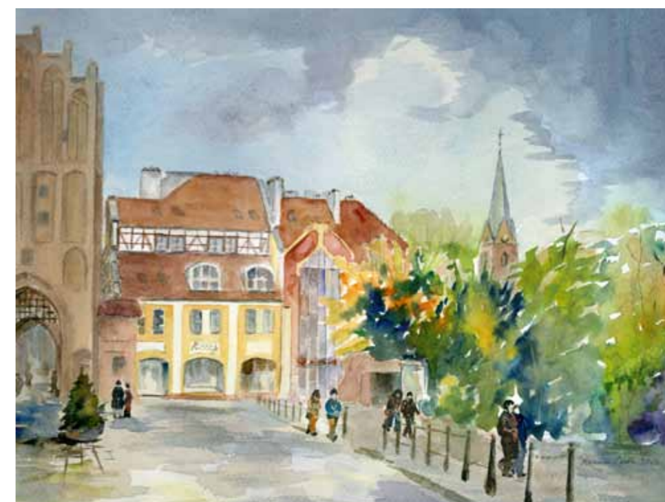
Współczesna zabudowa przy Wysokiej Bramie, 2011

Dziś po dawnym ceglany budynku komisariatu policji przylegającym do Wysokiej Bramy nie ma już śladu. W miejscu tym znajduje się hotel oraz restauracja.