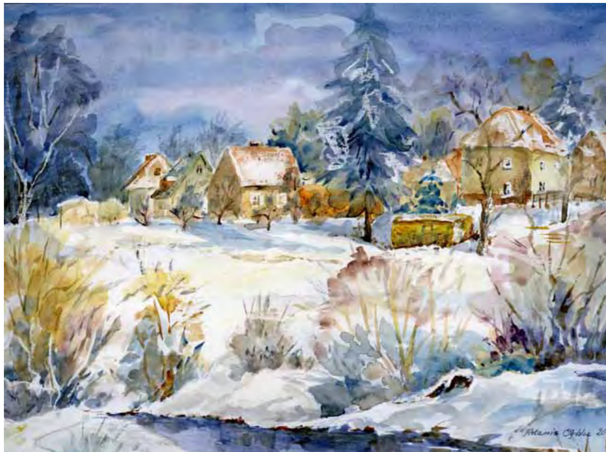
Widok na ul. Grabowskiego z mostu nad Łyną, 2000r.