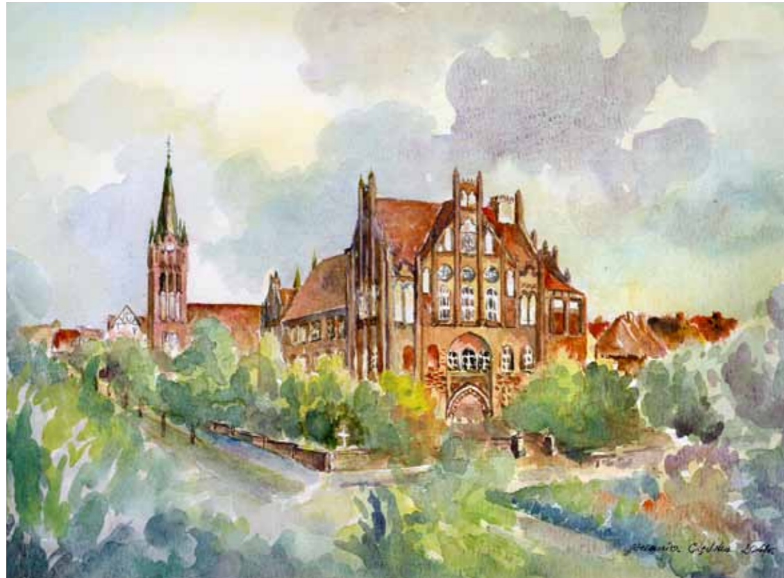
Miejska Szkoła Średnia dla chłopców, 1900 r.

Monumentalny neogotycki budynek Miejskiej Szkoły Średniej dla chłopców został uroczyście oddany do użytku w 1900 r. Budynek znakomicie harmonizował się ze znajdującym się w tle kościołem Najświętszego Serca Jezusowego. Pod koniec II wojny światowej szkoła pełniła funkcję lazaretu Wermachtu. Gmach został podpalony w 1945 r. a jego fundamenty po wojnie wykorzystano przy budowie obecnego Urzędu Wojewódzkiego.