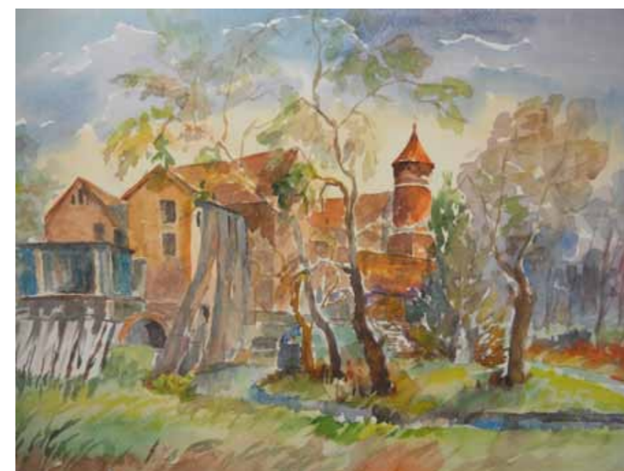
Nowa restauracja na miejscu starego młyna (w budowie)

Dziś nie ma śladu po tamtych klimatach. Brzegi Łyny u podnóża zamku zostały zagospodarowane – atrakcją jest chętnie odwiedzany park zamkowy, który służy mieszkańcom i turystom jako miejsce odpoczynku i rekreacji. W miejscu dawnego młyna mieści się stylowa restauracja.