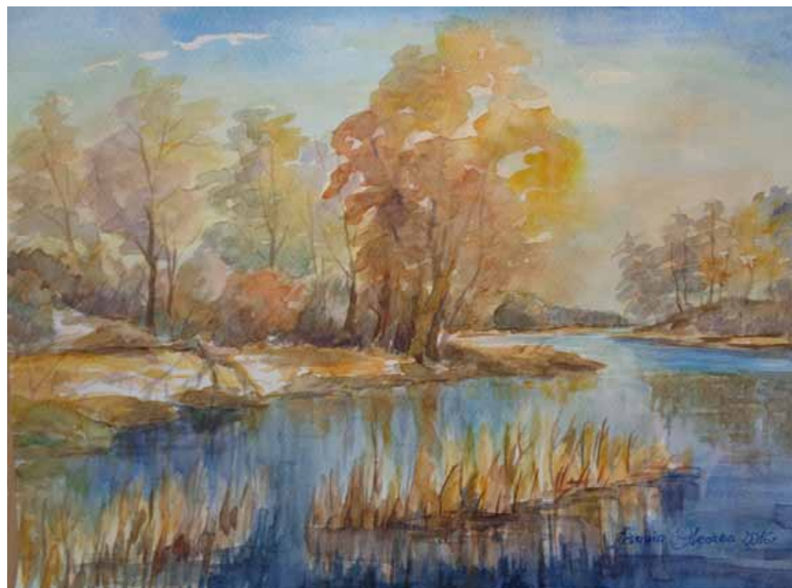
Jesień nad jeziorem Skanda