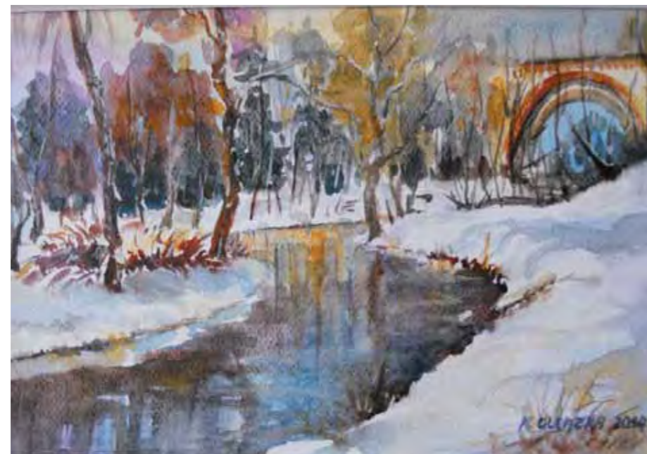
Olsztyn, widok współczesny na most św. Jakuba