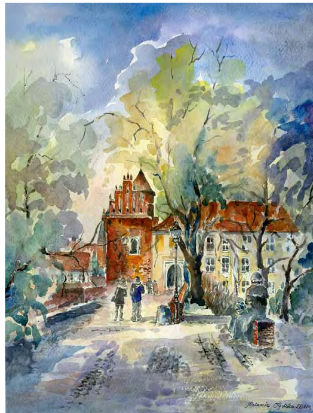
Olsztyn, ul. Zamkowa z pomnikiem Mikołaja Kopernika, widok współczesny

W 1917 roku, w celu upamiętnienia obecności i zasług wybitnego astronoma, przed wejście na groble zamkową wzniesiono pomnik Mikołaja Kopernika. Była to neogotycka budowla przypominająca kapliczkę z odlanym w brązie popiersiem uczonego. Niestety pomnik nie przetrwał wojny.