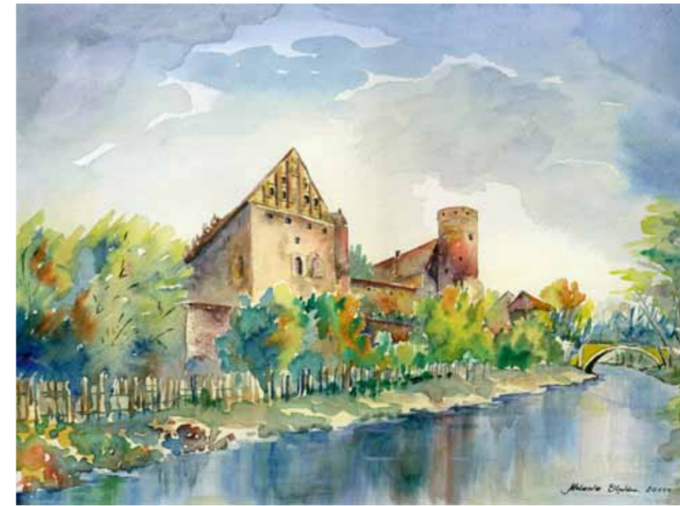
Zamek w Olsztynie od strony Łyny ok. 1910 widok od strony północno zachodniej, przed Mostem Zamkowym

Zamek kapituły warmińskiej został wzniesiony w zakolu Łyny przed połową XIV wieku. Pełnił funkcję skarbcza kapituły, spichlerza oraz centrum administracyjnego komornictwa. Był jedną z najsilniejszych warowni kapituły. W latach 1516-1521 funkcję administratora pełnił tutaj Mikołaj Kopernik. U podnóża zamku znajdowały się młyny wodne oraz kuźnia miedzi. Od XVII w. zamek zaczął tracić cechy obronne. Do gotyckiej budowli dobudowano późnobarokową część mieszkalną a w 1926 roku okrągła wieża zamku doczekała się zwieńczenia – stożkowego hełmu. Pod murami zamkowymi zaczęły pojawiać się inne zabudowania, m.in. słynna „VillaSchönebecka” zwana „Villą Mordu”. Szczęśliwie zamek przetrwał wojenne zawieruchy i cieszy oczy olsztyniaków do dnia dzisiejszego.