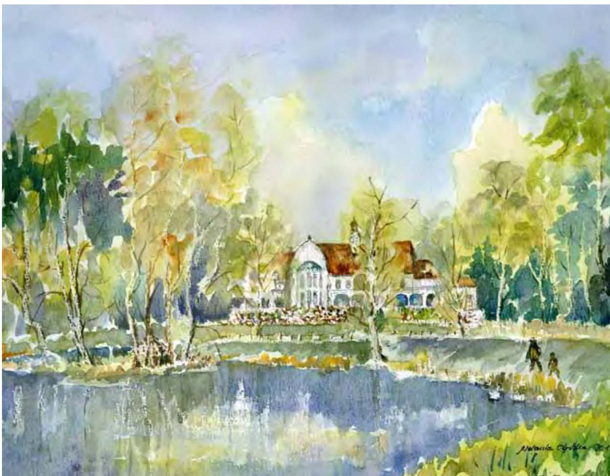
Budynek restauracji w Nowym Jakubowie

Okazały budynek restauracyjny w Nowym Jakubowie zbudowano w 1910 r. z okazji mającej odbyć się w Olsztynie Wystawy Przemysłowej. Budynek wzniesiono na wzgórzu nad jeziorkiem Mummel. Miała to być główna restauracja wystawy. Znalazła się w niej wielka scena, pokoje dla gości, pokój restauratora oraz inne pomieszczenia restauracyjne. Na froncie budynku usytuowano otwarte werandy. A na zboczu wzgórza schodzącym do jeziorka tarasy restauracyjne. Lokal cieszył się dużą popularnością w okresie międzywojennym. Budynek został spalony pod koniec wojny a następnie odbudowany. Obecnie mieści się w nim siedziba Centrum Edukacji i Inicjatyw Kulturalnych