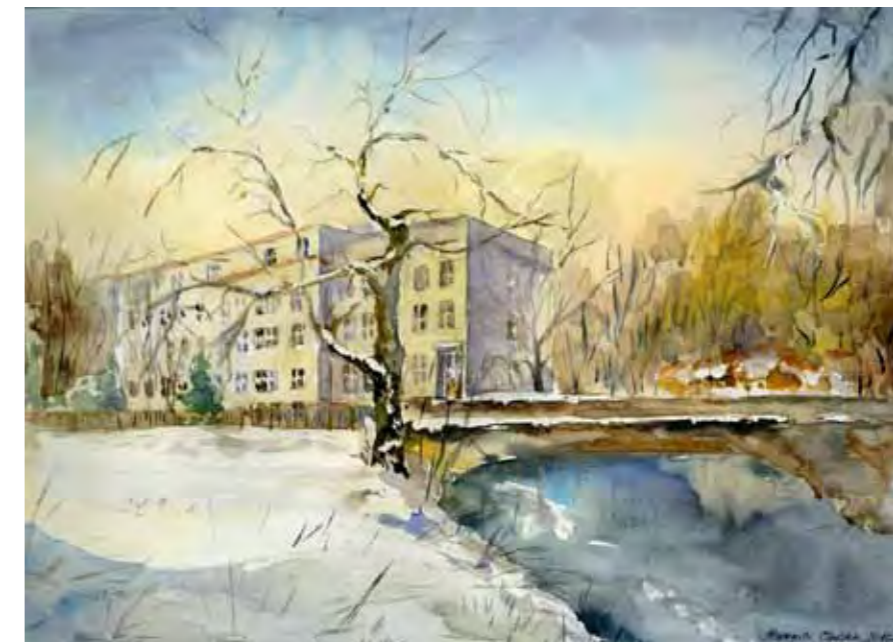
Budynek dawnego Starostwa Powiatowego, obecnie UWM