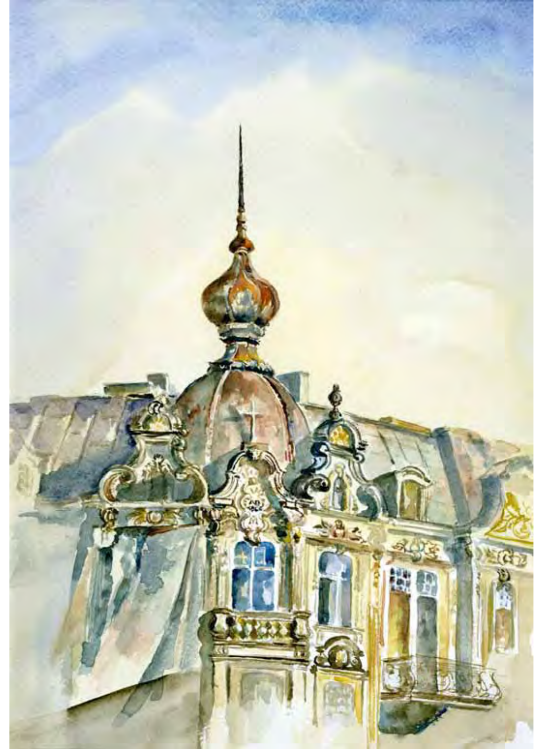
Kamienica przy pl. Bema w Olsztynie