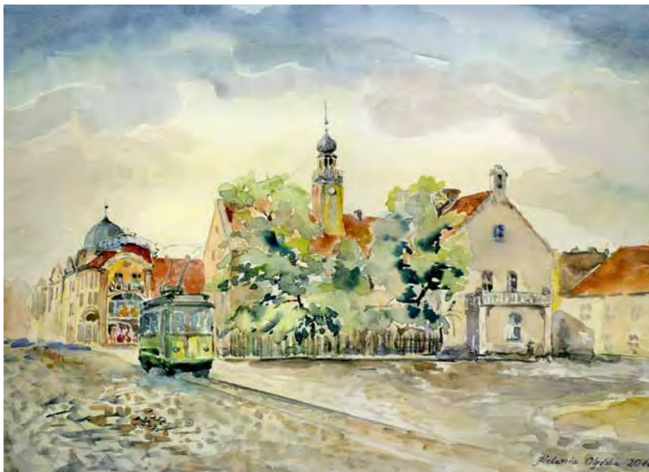
Stary ratusz, widok z 1910 r.

Stary ratusz wzniesiono w XV wieku. Był wielokrotnie przebudowywany. Niedawno odkryto pod tynkami ratusza cenne gotyckie fasady. Stary ratusz pełnił funkcję siedziby władz miejskich do 1916 roku.