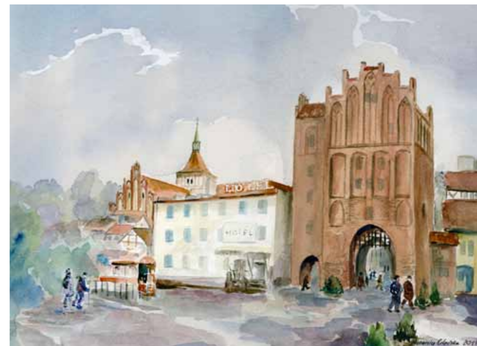
Wysoka Brama w Olsztynie, widok współczesny, 2011

Wysoka Brama – średniowieczna Brama Górna, niewątpliwie jest jednym z symboli Olsztyna. Na początku XX w. w Wysokiej Bramie mieścił się miejski areszt policyjny a w ceglany budynku przylegającym do bramy – komisariat policji i biuro meldunkowe. Nieodłącznym elementem krajobrazu były tramwaje – przy bramie znajdował się jeden z przystanków. Tramwaje kursowały pod Wysoką Bramą kierując się w stronę Starego Miasta.