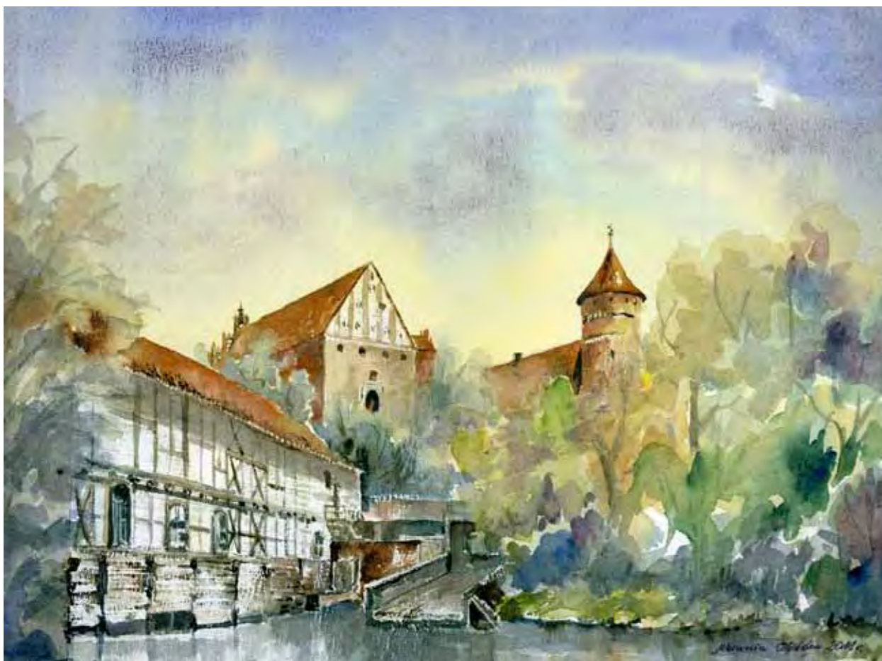
Zamek w Olsztynie po 1926 roku. Na pierwszym planie zabudowania starego młyna z ok. 1915