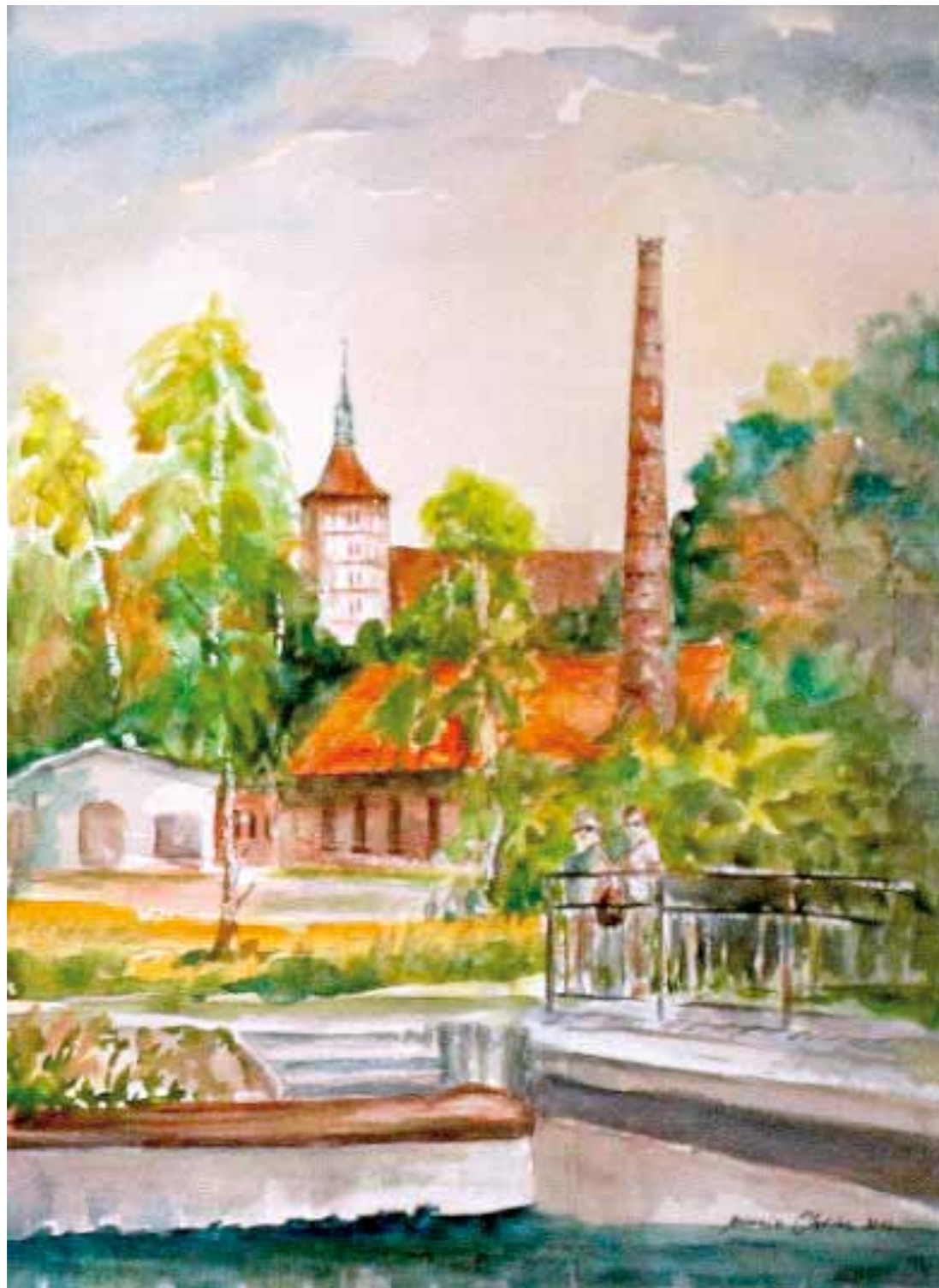
Dawny Tartak Raphaelsohnów

W okolicach obecnego Parku Centralnego rozbudowywała się w II poł. XIX w. dzielnica przemysłowa Olsztyna. Tartak Raphaelsohnów to ostatni jej relikw. W tamtym czasie działało tutaj pięć tartaków, młyn parowy, fabryka maszyn z odlewnią żelaza, fabryka octu, fabryka chemiczna oraz gazownia miejska. Położenie dzielnicy przemysłowej w tym miejscu było podyktowane bliską obecnością rzeki Łyny, która służyła jako droga transportu towarów. Obecnie tartak jest siedzibą Centrum Techniki i Rozwoju Regionu oraz Muzeum Nowoczesności.