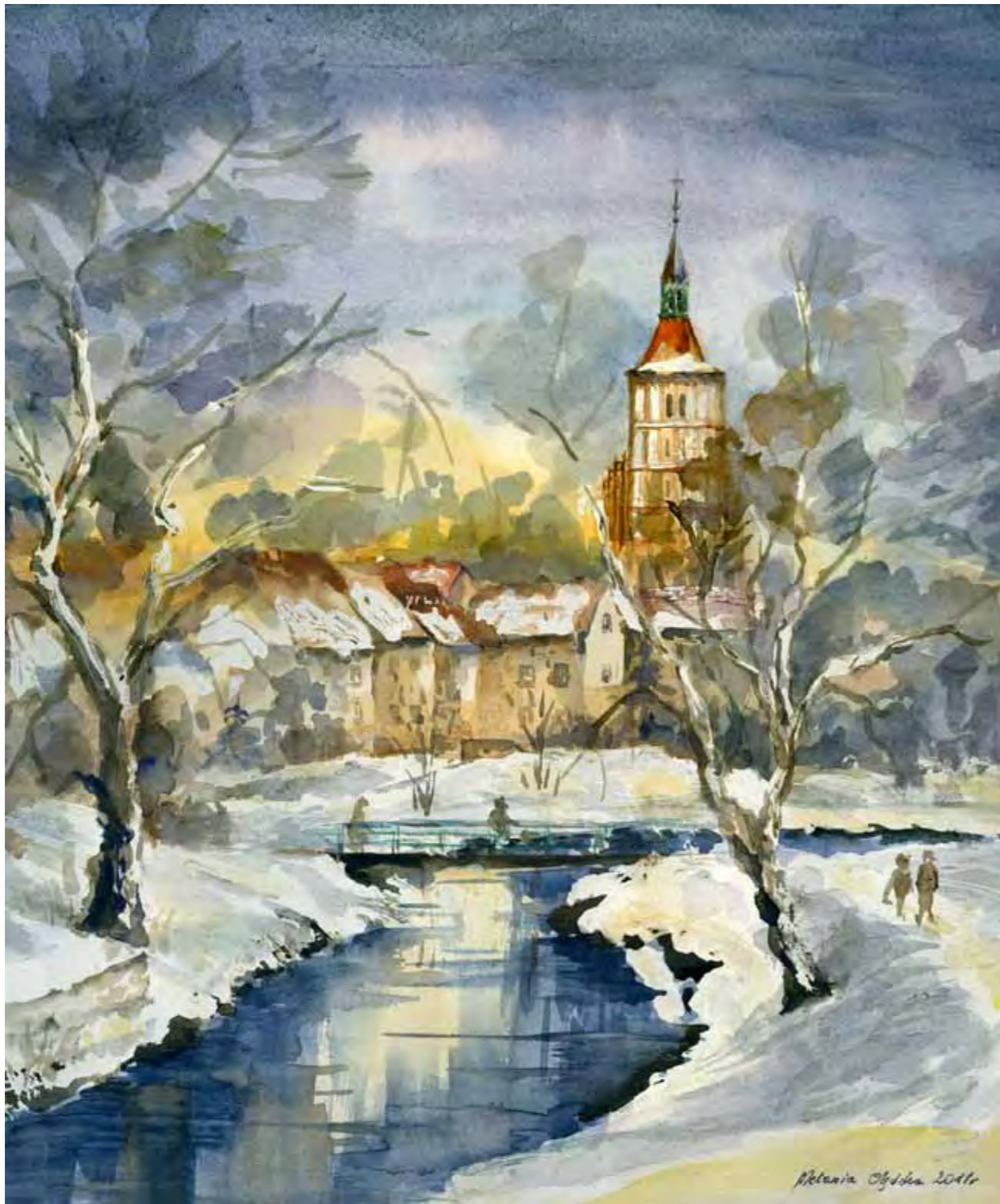
Widok na katedrę i Starówkę olsztyńską od strony Łyny Zabudowa na dawnych murach obronnych Olsztyna

Na początku XX wieku w okolicach katedry znajdowały się liczne szachulcowe budynki, szkoła ludowa a następnie zbudowany w 1914 r. a zdemontowany w 1966 r. Pomnik Schulze-Delitzscha. Obecnie spacerując wokół bazyliki ujrzymy: budynki parafialne, dom pielgrzyma oraz liczne lokale komunalne i usługowe.