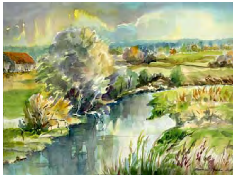
Pejzaż z Łyną

Takim pozostał Olsztyn do roku 1945, wtedy po raz kolejny zmienił swą przynależność państwową. Zniszczenia wojenne dokonane przez zdobywcą Armię Czerwoną i późniejsza polityka powojennych gospodarzy miasta w zakresie odbudowy i rozwoju Olsztyna w dużej mierze bezpowrotnie zatraciła jego historyczną tożsamość. Nie starczyło wiedzy, świadomości, chęci i pieniędzy na odtworzenie zniszczonych obiektów według