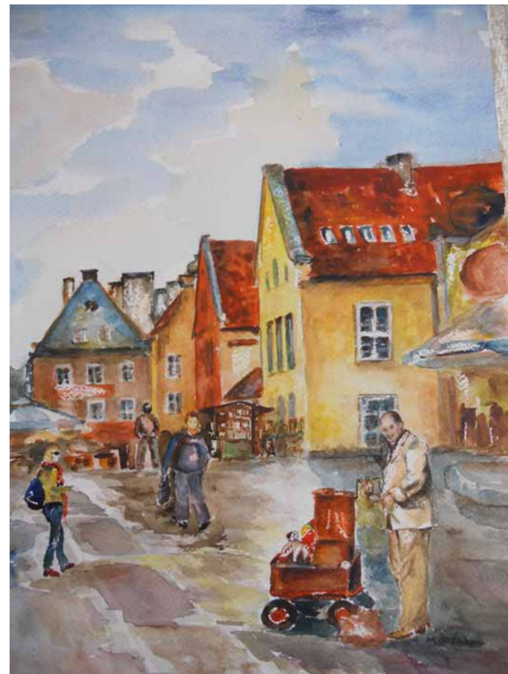
Stary ratusz, 2012

W 2003 r. Wysoka Brama została odrestaurowana. W niszy od strony Starego Miasta umieszczono wizerunek Matki Bożej Królowej Pokoju, podarowany Olsztynowi przez Jana Pawła II. Wysoka Brama stanowi niejako symboliczną granicę między nowoczesnym, coraz bardziej rozwijającym się miastem, a jego staromiejskim sercem sięgającym swym rodowodem średniowiecznego Olsztyna