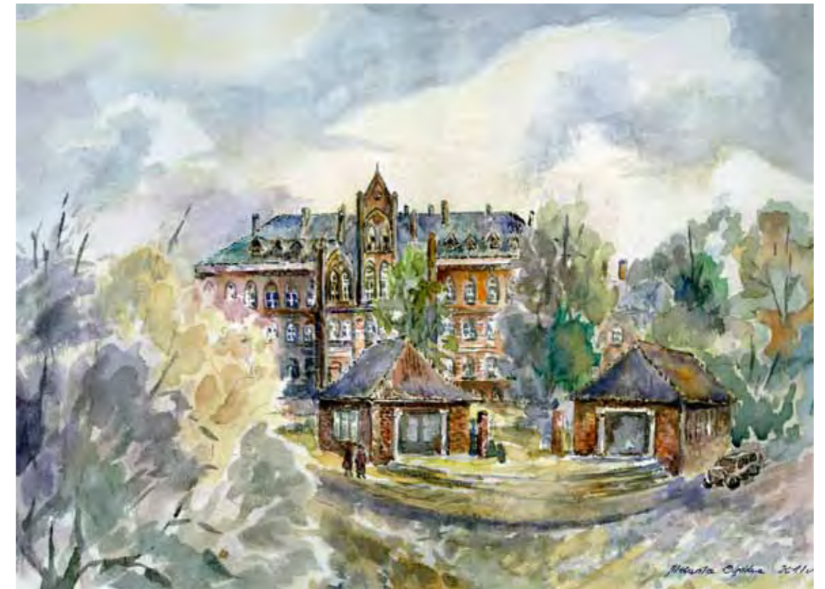
Gmach Sądu z 1880 r., spłonął w 1976 r.

Neogotycki budynek Sądu Okręgowego i Ziemskiego został wzniesiony w 1879 roku. Swoją ostateczną formę uzyskał w latach 1896-98. W pawilonach znajdujących się przed frontem gmachu miały swoje siedziby: biuro turystyczne oraz księgarnia. Obok gmachu przy ul. Piłsudskiego znajdował się postój taksówek. Gmach sądu spłonął w 1976 roku. Po przebudowie stracił niestety całkowicie swój zabytkowy charakter.