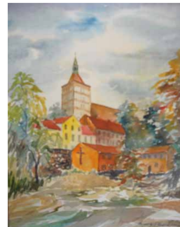
Dom Pielgrzyma u stóp katedry św. Jakuba w Olsztynie, po zakończeniu budowy