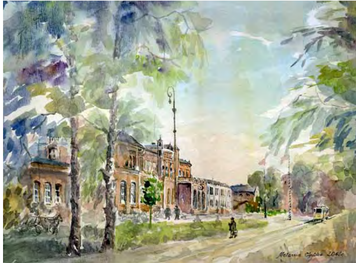
Kolejowy Dworzec Główny w Olsztynie, 1920

Budowę kolejowego Olsztyńskiego Dworca Głównego zakończono w 1872 roku. Początkowo miał zostać wybudowany na rogu obecnej ulicy 1 Maja ze zbiegiem torów kolejowych ale w ostateczności wzniesiono go z dala od centrum miasta na obecnej ul. Partyzantów. Architekturę dawnego dworca w Olsztynie przypominają zachowane do dziś dworce w Ostródzie i Barczewie. W 1945 roku dworzec spłonął. Po drugiej wojnie światowej zmieniono całkowicie jego wygląd.