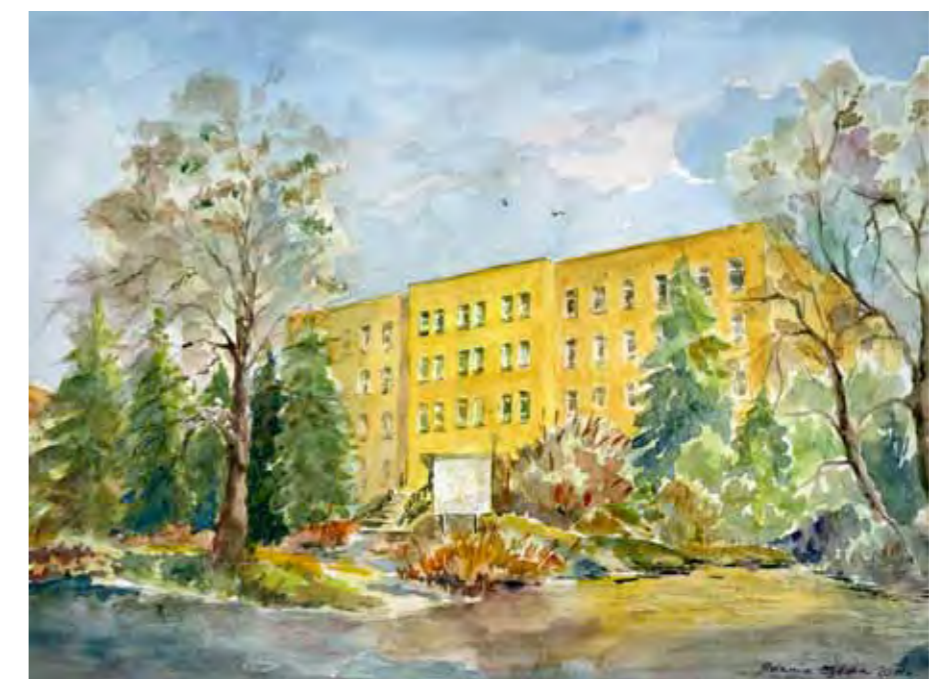
Gmach Sądu odbudowany po pożarze w 1976 r.