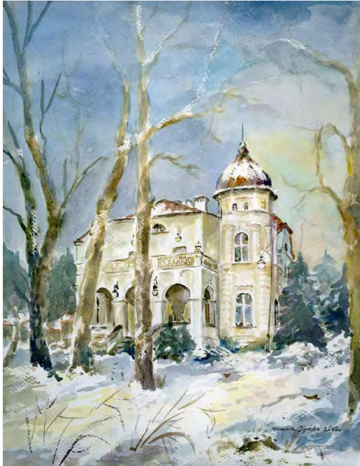
Muzeum Przyrody w Olsztynie

Piękny secesyjny pałacyk z końca XIX w. wraz z dawną wozownią otrzymało w 1982 r. od władz miasta Muzeum Warmii i Mazur w Olsztynie. Pałacyk został przekazany w bardzo złym stanie. Dopiero w 1999 r. doczekał się restauracji. Mieści się w nim Muzeum Przyrody z interesującymi zbiorami zoologicznymi, botanicznymi i geologicznymi.