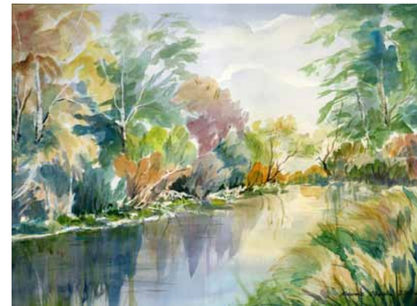
Jesień nad Łyną

Jedno się przez wieki nie zmieniło – Olsztyn był i jest miastem, którego najcenniejszym walorem jest otaczająca go przyroda. Lasy wokół miasta, jeziora w jego granicach, opasująca go rzeka Łyna, która przebiega przez całą Warmię, stanowią nieprzecenioną wartość. Lokalne władze poświęcają wiele uwagi i trudu nad zachowaniem tej wartości – odpowiednie zagospodarowanie na użytek mieszkańców bez naruszenia praw należnych naturze. Niezależnie od tego, władze miasta dbają o zachowanie jak największej przestrzeni dla zieleni, rekreacji i odpoczynku dla mieszkańców w rozbudowującym się Olsztynie. Stąd coraz więcej lepiej zadbanych parków, zieleńców, plant i możliwości aktywnego wypoczynku na łonie przyrody.