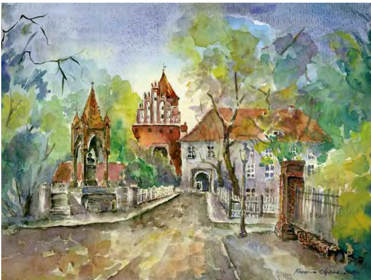
Olsztyn, ul. Zamkowa z pomnikiem Mikołaja Kopernika z 1916 r.

W 1917 roku, w celu upamiętnienia obecności i zasług wybitnego astronoma, przed wejście na groble zamkową wzniesiono pomnik Mikołaja Kopernika. Była to neogotycka budowla przypominająca kapliczkę z odlanym w brązie popiersiem uczonego. Niestety pomnik nie przetrwał wojny.