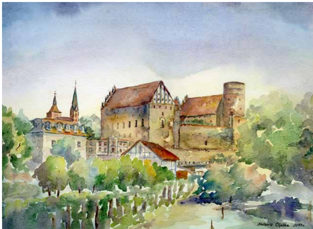
Widok na zamek w Olsztynie od strony północno-zach., ok.1915 r. u stóp zamku widoczne zabudowania młyna