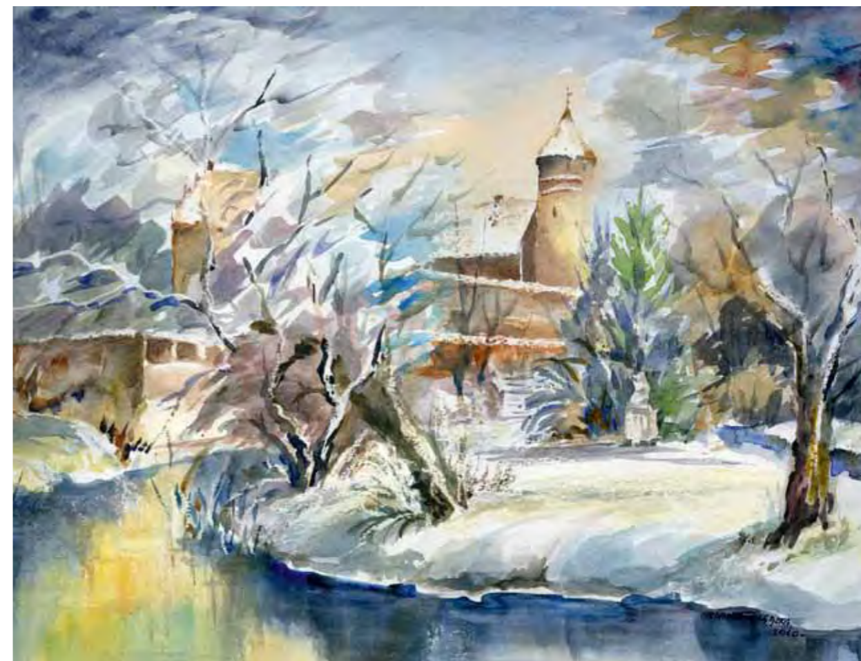
Zamek w Olsztynie – miejsce po dawnym młynie

Wiele miast położonych nad rzekami miały swoje malownicze „Wenecje”. W Olsztynie takim miejscem były tyły domów na ul. Mochneckiego. Miejskie zaułki schodziły bezpośrednio nad rzekę, nad której brzegiem stały zabudowy gospodarskie. Kładki i pomosty umożliwiały korzystanie z wody.