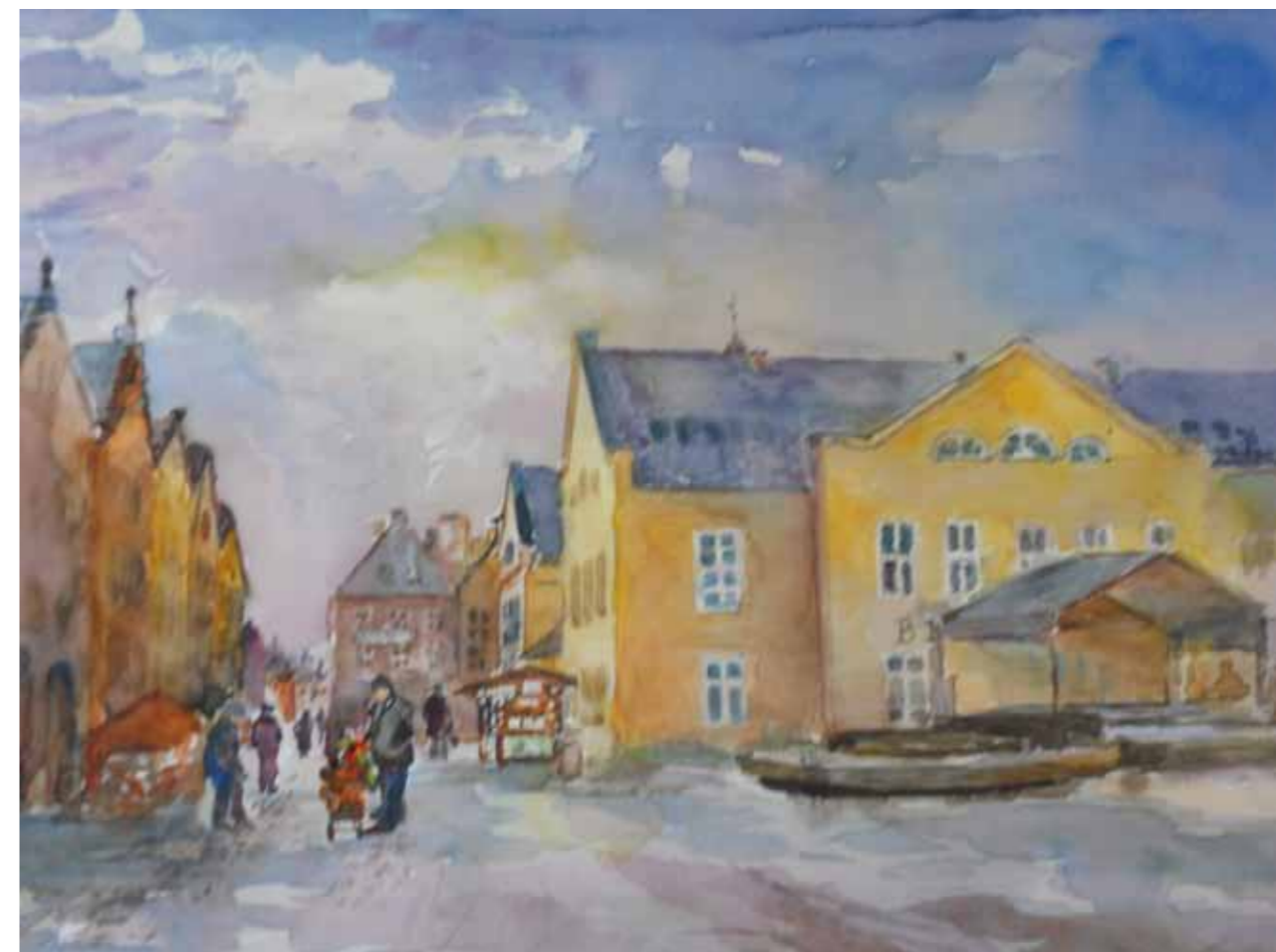
Współczesna zabudowa przy Wysokiej Bramie, 2011

Stary ratusz wzniesiono w XV wieku. Był wielokrotnie przebudowywany. Niedawno odkryto pod tynkami ratusza cenne gotyckie fasady. Stary ratusz pełnił funkcję siedziby władz miejskich do 1916 roku.