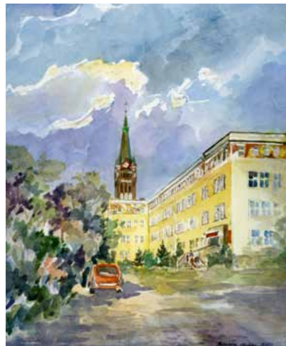
Dawniej była tu szkoła realna, dziś Urząd Wojewódzki

Neogotycki budynek Sądu Okręgowego i Ziemskiego został wzniesiony w 1879 roku. Swoją ostateczną formę uzyskał w latach 1896-98. W pawilonach znajdujących się przed frontem gmachu miały swoje siedziby: biuro turystyczne oraz księgarnia. Obok gmachu przy ul. Piłsudskiego znajdował się postój taksówek. Gmach sądu spłonął w 1976 roku. Po przebudowie stracił niestety całkowicie swój zabytkowy charakter.