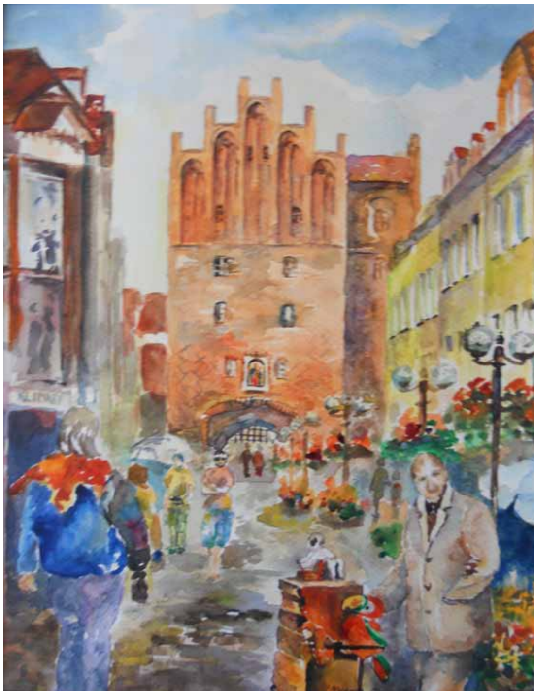
Wysoka Brama od strony Starówki, 2012

W 2003 r. Wysoka Brama została odrestaurowana. W niszy od strony Starego Miasta umieszczono wizerunek Matki Bożej Królowej Pokoju, podarowany Olsztynowi przez Jana Pawła II. Wysoka Brama stanowi niejako symboliczną granicę między nowoczesnym, coraz bardziej rozwijającym się miastem, a jego staromiejskim sercem sięgającym swym rodowodem średniowiecznego Olsztyna