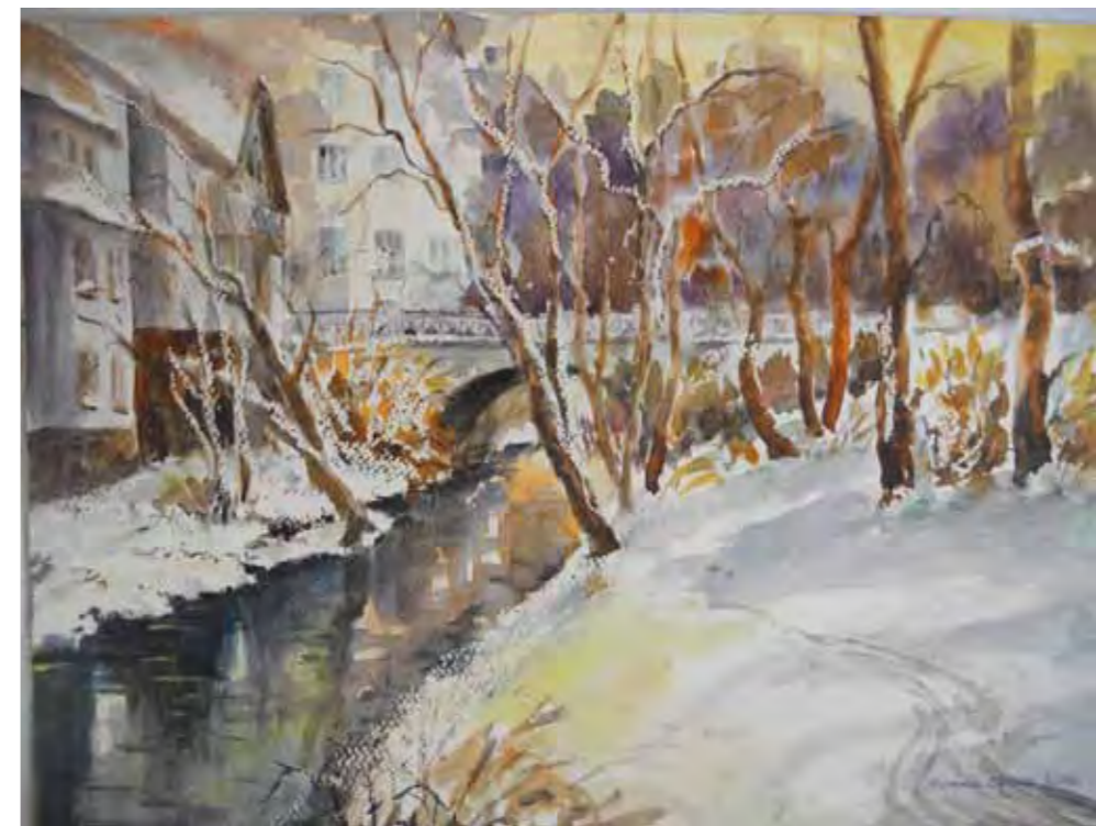
Olsztyn, widok współczesny na most św. jakuba