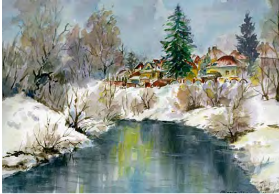
Widok na nowe zabudowania przy ul. Grabowskiego w Olsztynie

Budynki mieszkalne wciąż są budowane nad brzegami rzeki Łyny. Nie posiadają już może uroku „przedwojennej Wenecji” ale nadal przyciągają wzrok.