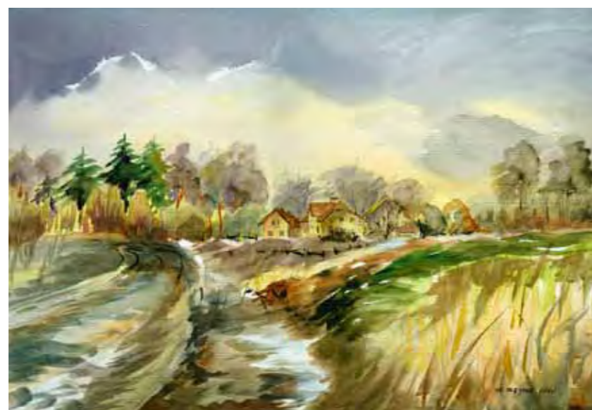
Przedwiośnie na przedmieściach Olsztyna

Olsztyn jest miastem wyjątkowym ze względu na położenie i jego naturalne walory przyrodnicze – to miasto lasów i 16 jezior. Nie trzeba daleko szukać aby móc nacieszyć oczy pięknymi krajobrazami o każdej porze roku.