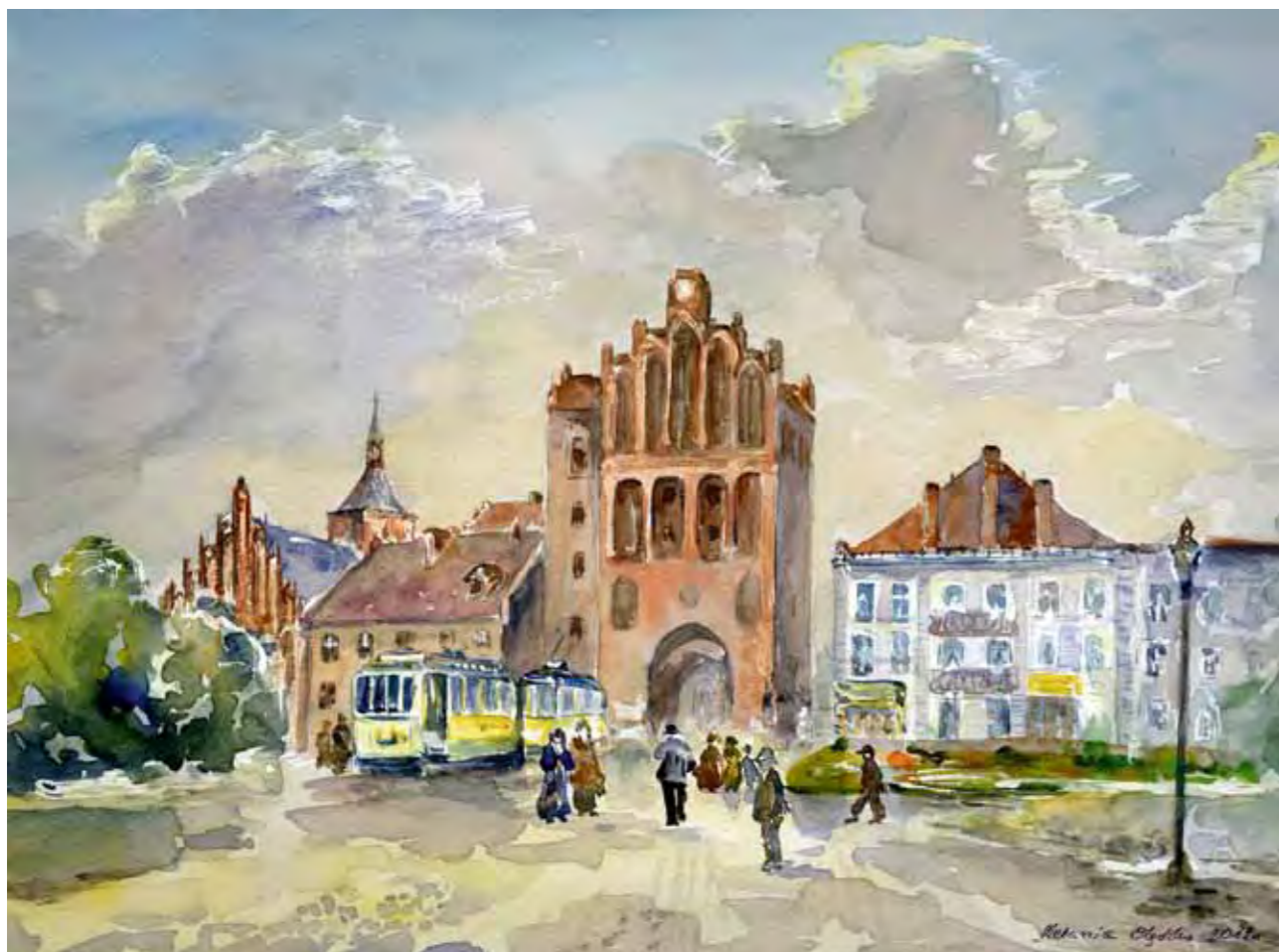
Wysoka Brama, ok. 1910 r.

Wysoka Brama – średniowieczna Brama Górna, niewątpliwie jest jednym z symboli Olsztyna. Na początku XX w. w Wysokiej Bramie mieścił się miejski areszt policyjny a w ceglany budynku przylegającym do bramy – komisariat policji i biuro meldunkowe. Nieodłącznym elementem krajobrazu były tramwaje – przy bramie znajdował się jeden z przystanków. Tramwaje kursowały pod Wysoką Bramą kierując się w stronę Starego Miasta.