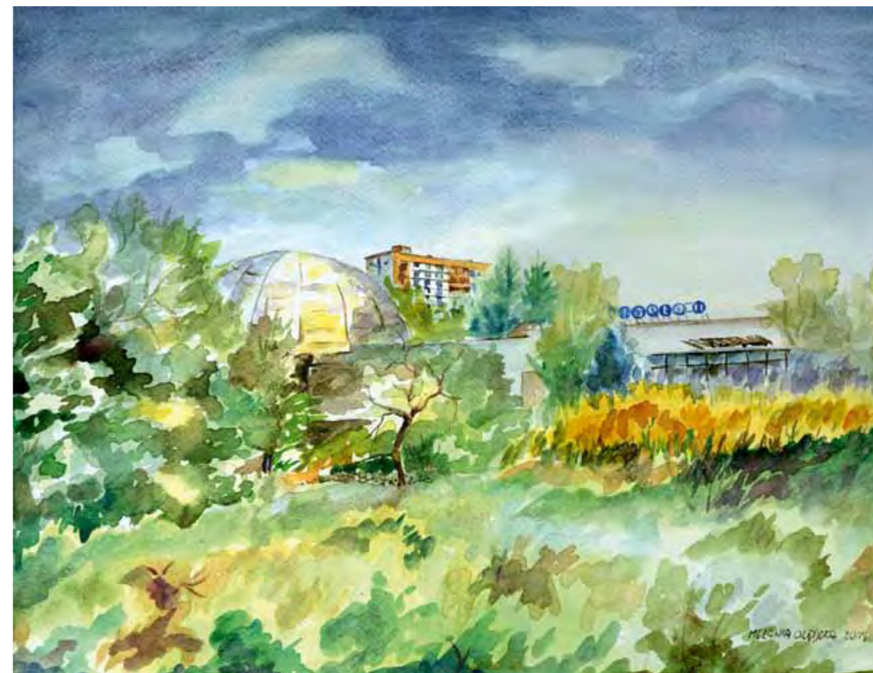
Planetarium w Olsztynie i biblioteka Planeta

Okazały budynek restauracyjny w Nowym Jakubowie zbudowano w 1910 r. z okazji mającej odbyć się w Olsztynie Wystawy Przemysłowej. Budynek wzniesiono na wzgórzu nad jeziorkiem Mummel. Miała to być główna restauracja wystawy. Znalazła się w niej wielka scena, pokoje dla gości, pokój restauratora oraz inne pomieszczenia restauracyjne. Na froncie budynku usytuowano otwarte werandy. A na zboczu wzgórza schodzącym do jeziorka tarasy restauracyjne. Lokal cieszył się dużą popularnością w okresie międzywojennym. Budynek został spalony pod koniec wojny a następnie odbudowany. Obecnie mieści się w nim siedziba Centrum Edukacji i Inicjatyw Kulturalnych