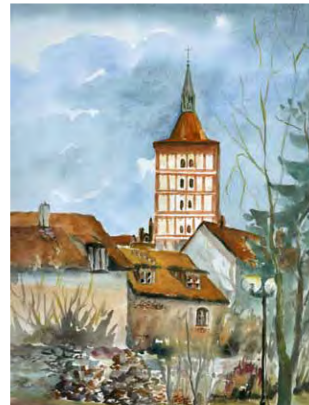
Katedra św. Jakuba w Olsztynie Zabudowa na dawnych murach obronnych Olsztyna